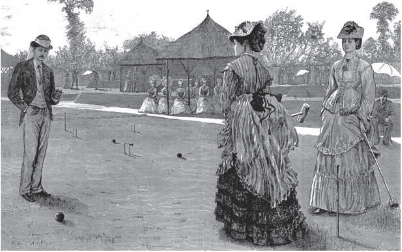
चित्र 8 - औरतों के लिए क्रिकेट नहीं बल्कि क्रोकेट.

औरतों के लिए कठिन और प्रतिस्पर्धी खेल अच्छा नहीं माना जाता था। क्रोकेट एक धीमी गति वाला सौम्य खेल था जिसे औरतों के लिए, खासतौर से उच्चवर्गीय औरतों के लिए अच्छा माना जाता था। खिलाड़ियों के लंबे गाउन, झालरों और टोपियों से उनके खेलों के स्वरूप की झलक मिलती है। इलस्ट्रेटेड लंदन न्यूज़, 20 जुलाई 1872 से।