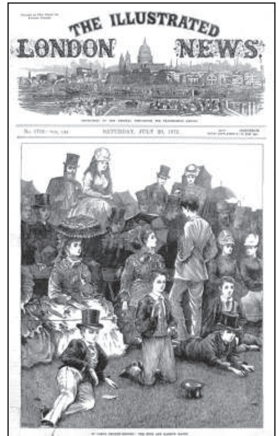
चित्र 7 - लॉर्ड्स पर ईटन और हैरो नामक मशहूर पब्लिक स्कूलों के बीच क्रिकेट का मैच.

सच्ची बात तो यह है कि नेपोलियन के खिलाफ़ लड़ाई इसलिए जीती जा सकी कि स्कॉटलैंड व वेल्स के लौह उद्योग, लंकाशायर की मिलों व सिटी ऑफ़ लंदन के वित्तीय घरानों से भरपूर सहयोग मिला। इंग्लैंड के व्यापार व उद्योग में आगे होने के चलते ब्रिटेन विश्व की सबसे बड़ी ताकत बन गया था, लेकिन अंग्रेज़ी शासक-वर्ग को यही खयाल अच्छा लगता था कि दुनिया में उनकी श्रेष्ठता के पीछे आवासीय विद्यालयों में पढ़कर तैयार हुए और शरीफ़ों का खेल-क्रिकेट-खेलनेवाले युवावर्ग का चरित्र ही है।