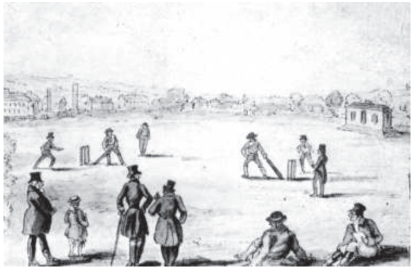
चित्र 2 - लॉर्ड्स, इंग्लैंड क्रिकेट मैदान का एक चित्रकार द्वारा बनाया गया चित्र, 1821.