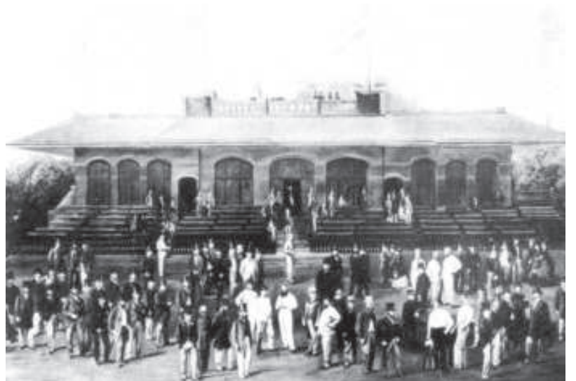
चित्र 3 - मेरिलिबॉन क्रिकेट क्लब (एमसीसी) का पैविलियन, 1874.

ऐसा लगता है कि 40 नॉच या रन का स्कोर काफ़ी बड़ा होता था, शायद इसलिए कि गेंदबाज़ तेज़ी से बल्लेबाज़ के नंगे, पैडरहित पिंडलियों पर गेंद फेंकते थे। दुनिया का पहला क्रिकेट क्लब हैम्बल्डन में 1760 के दशक में बना और मेरिलिबॉन क्रिकेट क्लब (एमसीसी) की स्थापना 1787 में हुई। इसके अगले साल ही एमसीसी ने क्रिकेट के