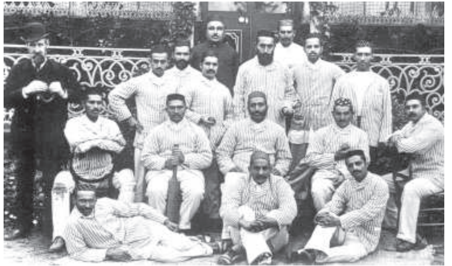
चित्र 13 - पारसी टीम, पहली भारतीय क्रिकेट टीम जिसने 1886 में इंग्लैंड का दौरा किया। परंपरागत क्रिकेट पोशाक के साथ वे पारसी टोपी भी पहने हुए हैं।

पारसी जिमखाना क्लब की स्थापना ने जैसे एक नई परंपरा डाल दी, दूसरे भारतीयों ने भी धर्म के आधार पर क्लब बनाने चालू कर दिए। हिंदू व मुसलमान दोनों ही 1890 के दशक में हिंदू व इस्लाम जिमखाना के लिए पैसे इकट्ठे करते दिखाई दिए। ब्रिटिश औपनिवेशिक भारत को राष्ट्र नहीं मानते थे-उनके लिए तो यह जातियों, नस्लों व धर्मों के लोगों का एक समुच्चय था, जिन्हें उन्होंने उपमहाद्वीप के स्तर पर एकीकृत किया। 19वीं सदी के अंत में कई हिंदुस्तानी संस्थाएँ व आंदोलन जाति व धर्म के आधार पर ही बने क्योंकि औपनिवेशिक सरकार भी इन बँटवारों को बढ़ावा देती थी-सामुदायिक संस्थाओं को फ़ौरन मान्यता मिल जाती थी। मिसाल के तौर पर, इस्लाम जिमखाना द्वारा बम्बई के समुद्री