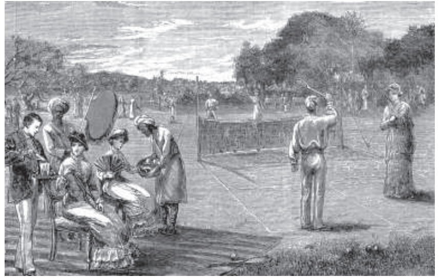
चित्र 9 - औपनिवेशिक भारत के मैदानों में दोपहर बाद टेनिस.

हालाँकि ब्रिटिश शाही अफसर उपनिवेशों में यह खेल लेकर जरूर आए पर इसके प्रसार के लिए, खास तौर पर वेस्ट इंडीज़ व हिंदुस्तान जैसे गैर-गोरे उपनिवेशों में, उन्होंने शायद ही कोई प्रयास किया। क्रिकेट खेलना यहाँ सामाजिक व नस्ली श्रेष्ठता का प्रतीक बन गया और अफ्रीकी-कैरिबियाई आबादी को क्लब क्रिकेट खेलने से हमेशा हतोत्साहित किया गया। नतीजतन, इस पर गोरे बागान-मालिकों और उनके नौकरों का बोलबाला रहा। वेस्ट इंडीज़ में पहला गैर-गोरा क्लब उन्नीसवीं सदी के अंत में बना और यहाँ भी सदस्य हल्के रंगवाले मुलैट्टो समुदाय के थे। इस तरह काले रंग के लोग समुद्री बीचों पर, सुनसान गलियों और पार्कों में बड़ी संख्या में