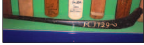
चित्र 1 - आज मौजूद सबसे पुराना बल्ला. इसके मुड़े हुए सिरे को देखें जो हॉकी स्टिक जैसा लगता है।

क्रिकेट के इस इतिहास में पहले हम इंग्लैंड में इसके विकास को देखेंगे और उस समय प्रचलित शारीरिक चुस्ती व प्रशिक्षण की संस्कृति का भी जायज़ा लेंगे। तब हम भारत का रुख करते हुए क्रिकेट को यहाँ अपनाये जाने से लेकर इसमें हुए आधुनिक बदलावों तक की चर्चा करेंगे। हरेक खंड में हम देखेंगे कि खेल का इतिहास किस तरह सामाजिक इतिहास से नथा-गुँथा है।