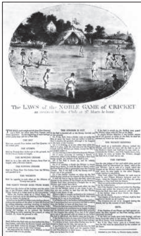
चित्र 4 - एमसीसी द्वारा निर्धारित और संशोधित होने वाले क्रिकेट के नियमों को इस रूप में नियमित रूप से प्रकाशित किया जाता था। बल्लेबाज़ी के नियमों को भी औपचारिक रूप से तय किया जाता था।

उसी तरह क्रिकेट में मैदान के आकार का अस्पष्ट होना उसकी ग्रामीण शुरुआत का सबूत है। क्रिकेट मूलतः गाँव के कॉमन्स में खेला जाता था। कॉमन्स ऐसे सार्वजनिक और खुले मैदान थे जिनपर पूरे समुदाय का साझा हक़ होता था। कॉमन्स का आकार हरेक गाँव में अलग-अलग होता था, इसलिए न तो बाउंड्री तय थी और न ही चौके। जब गेंद भीड़ में घुस जाती