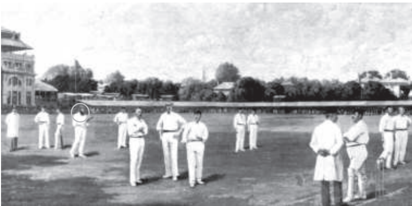
चित्र 6 - महान बल्लेबाज़ डब्ल्यू. जी. ग्रेस बल्लेबाज़ी के लिए आते हुए, लॉर्ड्स, 1895.

पोस्टर में शौकिया और पेशेवर खिलाड़ियों को 'जेंटलमैन' और 'प्लेयर्स' कह कर संबोधित किया गया है। उन्नीसवीं शताब्दी में होने वाले मैचों के विज्ञापन रंगमंच के पोस्टरों जैसे लगते थे और उनसे इस खेल के नाटकीय स्वरूप का पता चलता है।