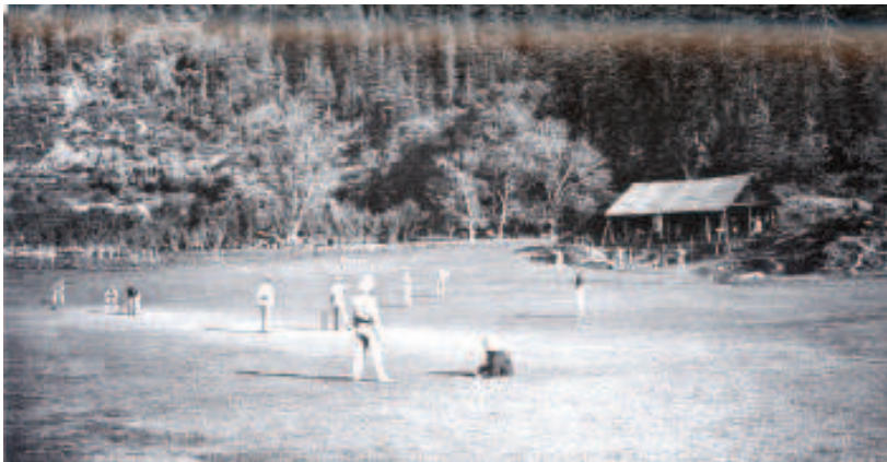
चित्र 10 - हिमालय की पृष्ठभूमि में मौज-मस्ती के लिए चल रहा खेल.

यहाँ चित्रकार ने यह दर्शाने का प्रयास किया है कि यह खेल मनोरंजन और व्यायाम, दोनों लिहाज़ से उपयोगी था। औरत-मर्द प्रतिस्पर्धा के लिए नहीं बल्कि मनोरंजन के लिए साथ-साथ खेल सकते थे। ग्राफिक, फरवरी 1880 से।