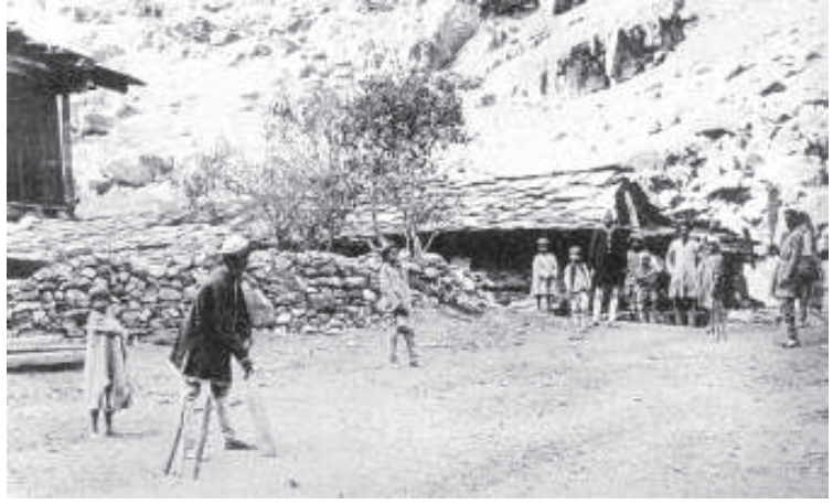
चित्र 11 - हिमालय के एक गाँव में लोग कामचलाऊ अंदाज़ में क्रिकेट खेल रहे हैं (1894)।

वेस्ट इंडीज़ में अभिजात गोरों की विशिष्टतावादी नीतियों के बावजूद कैरिबियाई द्वीप समूह में क्रिकेट महालोकप्रिय हो गया। क्रिकेट में कामयाबी का मतलब नस्ली समानता व राजनीतिक प्रगति हो गया। अपनी आजादी के समय, फ़ोर्ब्स बर्नहैम व एरिक विलियम्स जैसे नेताओं ने क्रिकेट में आत्मसम्मान और अंतर्राष्ट्रीय प्रतिष्ठा की संभावनाएँ देखीं। जब वेस्ट इंडीज़ ने 1950 के दशक में इंग्लैंड के खिलाफ़ अपनी पहली टेस्ट शृंखला जीती तो राष्ट्रीय उत्सव मनाया गया, मानो वेस्ट इंडियनों ने दिखा दिया हो कि वे गोरे अंग्रेज़ों से कम नहीं हैं। इस महान जीत में दो विडंबनाएँ थीं। पहली, विजयी वेस्ट इंडीज़ की टीम का कप्तान एक गोरा ही था। याद रहे कि