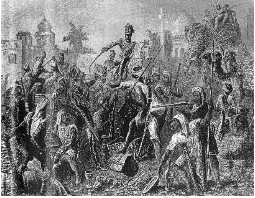
شکل 7- 1857 کے باغی

اس تصویر کی شبیہوں کا بغور مطالعہ کیجیے کیوں کہ یہ بنانے والے کے نقطہ نظر کی عکاسی کرتی ہیں۔ زیر نظر تصویر 1857 کی بغاوت کے بعد انگریزوں کی بہت سی کتابوں میں ملے گی۔ اس کی زیریں تحریر میں آپ کو یہ عبارت ملے گی۔ ”غدار سپاہی لوٹ کے مال میں حصہ لگاتے ہوئے“ برطانوی فکر کے اعتبار سے غدار سپاہی، جریص، بد اطوار اور خونخوار معلوم ہوتے ہیں۔ آپ اس بغاوت کے بارے میں پانچویں باب میں پڑھیں گے۔