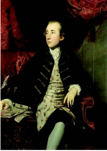
شکل 3- وارن ہیسٹنگز 1773 میں

ہندوستان کا پہلا گورنر جنرل مقرر ہوا۔ تاریخ کی کتابیں گورنر جنرلوں کے کارنامے بیان کرتی ہیں۔ سوانح نگاری میں ان کی شخصیت کو نمایاں کیا گیا ہے اور پینٹنگ ان کی طاقت کا مظہر ہیں۔