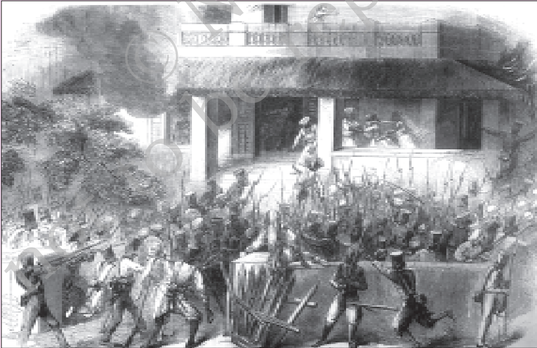
चित्र 3 - मेरठ में विद्रोही सिपाही अफ़सरों पर हमला करते हैं, उनके घरों में घुस जाते हैं और इमारतों में आग लगा देते हैं।

मेरा मानना है कि अवध पर हुए कब्ज़े से सिपाहियों के भीतर गहरा अविश्वास भर गया था और वे सरकार के खिलाफ़ साज़िशें रचने लगे थे। अवध के नवाब और दिल्ली बादशाह के नुमाइंदों को सेना की नब्ज़ जानने के लिए पूरे भारत में भेज दिया गया। उन्होंने सिपाहियों की भावनाओं को और हवा दी। उन्होंने सिपाहियों को बताया कि विदेशियों ने बादशाह के साथ कितना बड़ा धोखा किया है। उन्होंने हज़ार झूठ गढ़ डाले और सिपाहियों को अपने मालिकों, अंग्रेजों के खिलाफ़ बगावत करने के लिए उकसाया ताकि दिल्ली में बादशाह को दोबारा गद्दी पर बैठाया जा सके। उनकी दलील थी कि अगर सिपाही मिलकर काम करें और इन सुझावों पर अमल करें तो सेना ऐसा कर सकती है।