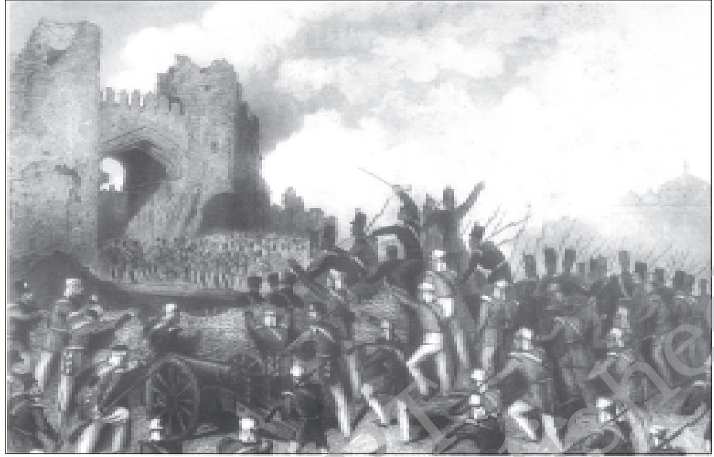
चित्र 8 - अंग्रेज टुकड़ियाँ दिल्ली में घुसने के लिए कश्मीरी गेट को बारूद से उड़ा देती हैं।

का विश्वास जीतने के लिए हर संभव प्रयास किया। उन्होंने वफ़ादार भूस्वामियों के लिए ईनामों का ऐलान कर दिया। उन्हें आश्वासन दिया गया कि उनकी ज़मीन पर उनके परंपरागत अधिकार बने रहेंगे। जिन्होंने विद्रोह