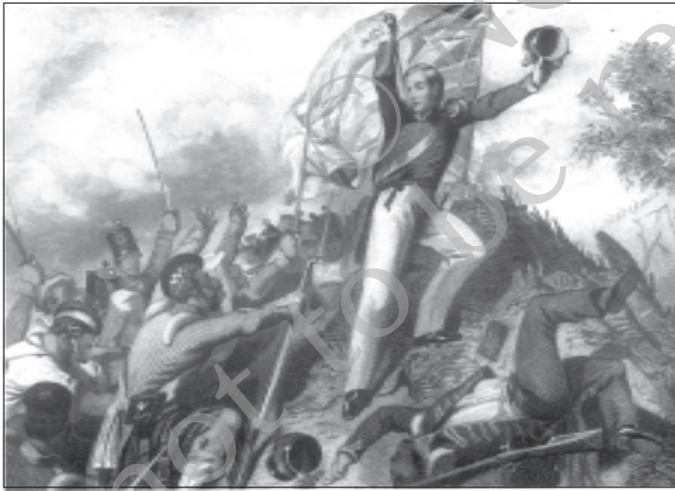
चित्र 9 - अंग्रेज टुकड़ियाँ कानपुर के पास विद्रोहियों को पकड़ लेती हैं।

का विश्वास जीतने के लिए हर संभव प्रयास किया। उन्होंने वफ़ादार भूस्वामियों के लिए ईनामों का ऐलान कर दिया। उन्हें आश्वासन दिया गया कि उनकी ज़मीन पर उनके परंपरागत अधिकार बने रहेंगे। जिन्होंने विद्रोह