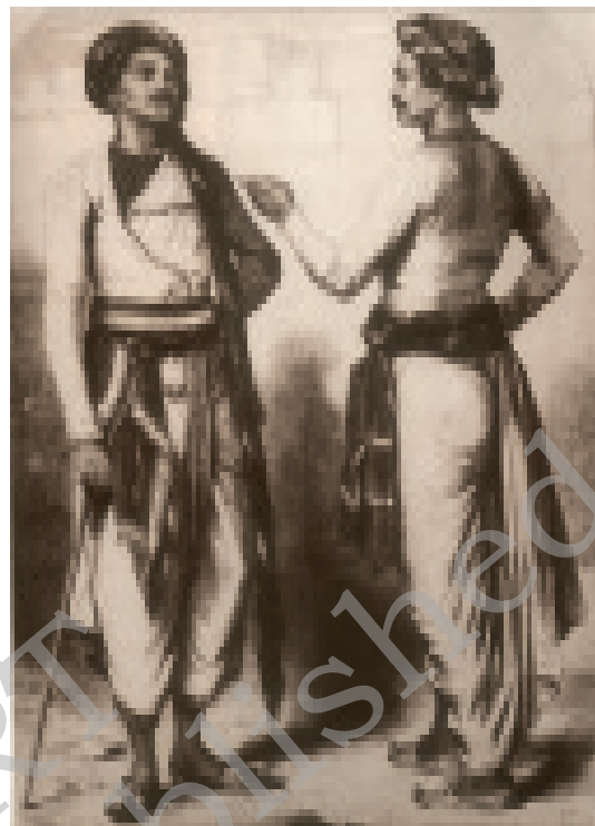
चित्र 2 - उत्तर भारत के बाज़ारों में सिपाही खबरें और अफ़वाहें फैलाने लगते हैं।

उस ज़माने में लोग अंग्रेज शासन के बारे में क्या सोच रहे थे, इसका जायजा लेने के लिए आप स्रोत 1 और 2 को पढ़ें।