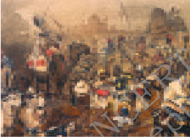
चित्र 1 - सिपाही और किसान विद्रोह के लिए ताकत जुटाते हैं। यह विद्रोह 1857 में उत्तर भारत के मैदानों में फैल गया था।