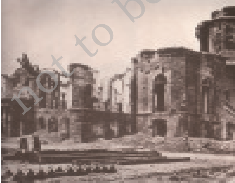
चित्र 12 - लखनऊ रेज़िडेंसी के खण्डहर।

जून 1857 में विद्रोही टुकड़ियों ने रेज़िडेंसी को कब्जे में ले लिया। बहुत सारी अंग्रेज़ औरतों, मर्दों और बच्चों ने रेज़िडेंसी की इमारतों में पनाह ली हुई थी। विद्रोहियों ने इस पूरे परिसर को घेरकर उन पर गोलों से हमला किया। इसी तरह के एक गोले से अवध के चीफ़ कमिश्नर हेनरी लॉरेंस की भी मौत हो गई थी। हेनरी लॉरेंस जिस कमरे में मरे वह इस चित्र में दिखाई दे रहा है। ग़ौर से देखें कि इमारतों पर बीते दौर के निशान किस तरह बचे रह जाते हैं।