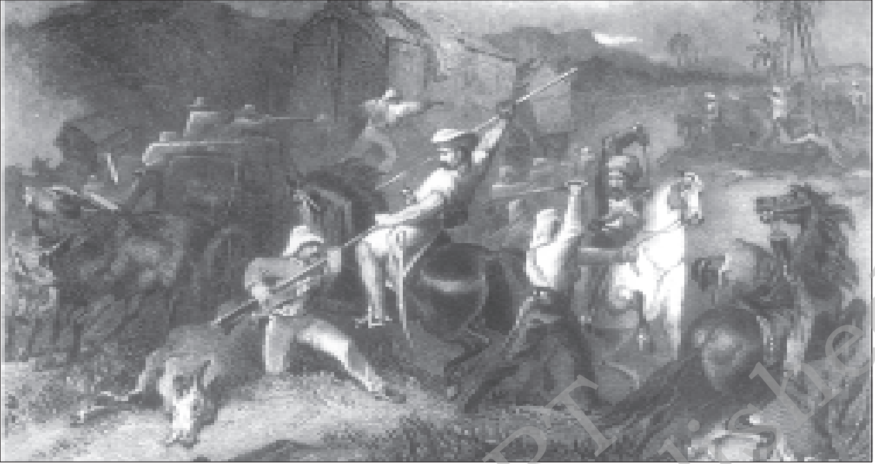
चित्र 4 - कैवेलरी लाइनों में युद्ध।

3 जुलाई 1857 को 3,000 से ज्यादा विद्रोही बरेली से दिल्ली आ पहुँचे। उन्होंने यमुना को पार किया और ब्रिटिश कैवेलरी चौकियों पर धावा बोल दिया। यह युद्ध पूरी रात चलता रहा।