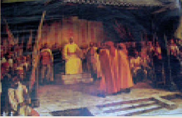
चित्र 11 - ताइपिंग की सेना अपने नेता से मिलते हुए

जब 1857 में भारत में विद्रोह फैला उसी समय चीन के दक्षिणी भागों में भी एक विशाल जनविद्रोह पैदा हो रहा था। यह विद्रोह 1850 में शुरू हुआ और 1860 के मध्य में जाकर खत्म हुआ। हाँग जिकुआंग के नेतृत्व में हजारों मेहनतकश, गरीब लोगों ने परम शांति के स्वर्गिक साम्राज्य की स्थापना के लिए लड़ाई लड़ी। इस विद्रोह को ताइपिंग विद्रोह के नाम से जाना जाता है।