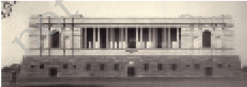
चित्र 4 - भारतीय राष्ट्रीय अभिलेखागार 1920 के दशक में बनाया गया।

उन्हें खुशनवीसी के माहिर लिखते थे। खुशनवीसी या सुलेखनवीस ऐसे लोग होते हैं जो बहुत सुंदर ढंग से चीजें लिखते हैं। उन्नीसवीं सदी के मध्य तक छपाई