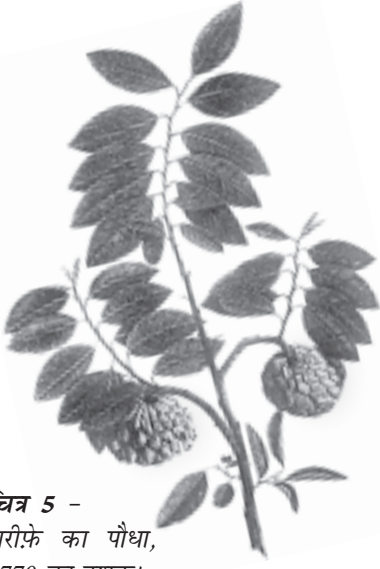
चित्र 5 - शरीफे का पौधा, 1770 का दशक।

अंग्रेजों द्वारा बनाए गए वानस्पतिक उद्यान और प्राकृतिक इतिहास के संग्रहालयों में विभिन्न पौधों के नमूने और उनसे संबंधित जानकारीयों इकट्ठा की जाती थीं। इन नमूनों के चित्र स्थानीय कलाकारों से बनवाए जाते थे। अब इतिहासकार इस बात पर ध्यान दे रहे हैं कि इस तरह की जानकारी किस तरह इकट्ठा की जाती थी और इससे उपनिवेशवाद के बारे में क्या पता चलता है।