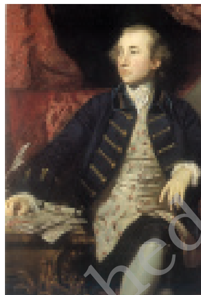
चित्र 3 - वॉरेन हेस्टिंग्स 1773 में भारत के पहले गवर्नर-जनरल बने।

मिल को लगता था कि सारे एशियाई समाज सभ्यता के मामले में यूरोप से पीछे हैं। इतिहास की उनकी समझदारी ये थी कि भारत में अंग्रेज़ों के आने से पहले यहाँ हिंदू और मुसलमान तानाशाहों का ही राज चलता था। यहाँ चारों ओर केवल धार्मिक बैर, जातिगत बंधनों और अंधविश्वासों का ही बोलबाला