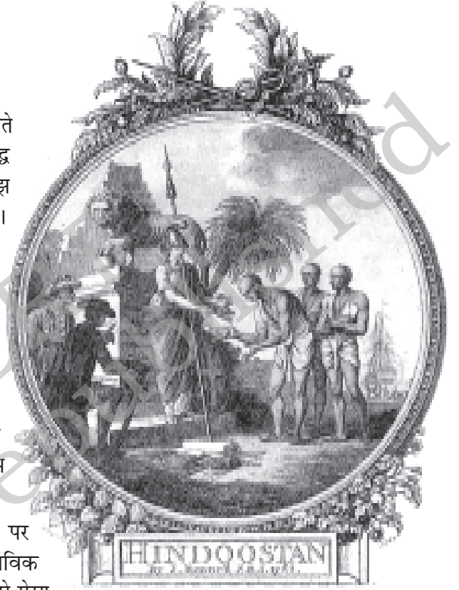
चित्र 1 – ब्राह्मण ब्रिटेनिया को शास्त्र भेंट कर रहे हैं, जेम्स रेनेल द्वारा तैयार किए गए पहले नक्शे का आवरण चित्र, 1782.

रोज़मर्रा की जिंदगी में हम अपने आसपास की चीजों पर हमेशा ऐतिहासिक सवाल नहीं उठाते। हम चीजों को स्वाभाविक मानकर चलते हैं। मानो जो कुछ हमें दिख रहा है वह हमेशा से ऐसा ही रहा हो। लेकिन हम सबके सामने कभी-कभी अचभे के क्षण आते हैं। कई बार हम उत्सुक हो जाते हैं और ऐसे सवाल पूछते हैं जो वाकई ऐतिहासिक होते हैं। किसी व्यक्ति को सड़क किनारे चाय के घूँट भरते देखकर आप इस बात पर हैरान हो सकते हैं कि चाय या कॉफी पीने का चलन शुरू कब से हुआ होगा? रेलगाड़ी की खिड़की से बाहर झाँकते हुए आपके जहन में यह सवाल उठ सकता है कि रेलवे का निर्माण कब हुआ? रेलगाड़ी के आने से पहले लोग दूर-दूर की यात्रा किस तरह कर पाते थे? सुबह-सुबह अख़बार पढ़ते हुए आप यह जानने के लिए उत्सुक हो सकते हैं कि जिस ज़माने में अख़बार नहीं छपते थे, उस समय लोगों को चीजों की जानकारी कैसे मिलती थी।