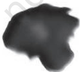
चित्र 5.3 : कोलतार।

यह एक अप्रिय गंध वाला काला गाढ़ा द्रव होता है (चित्र 5.3)। यह लगभग 200 पदार्थों का मिश्रण