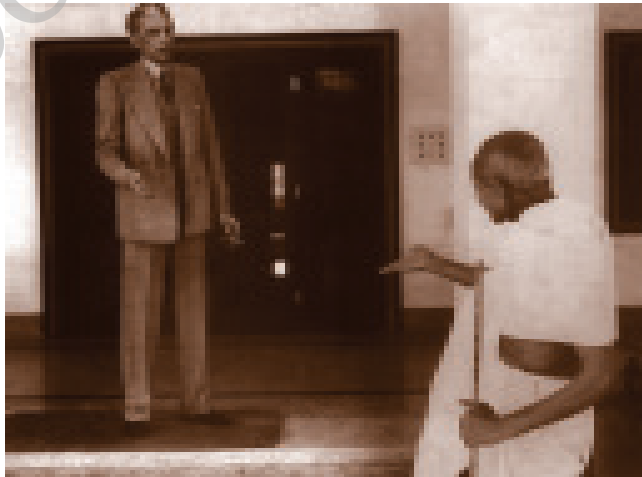
जिन्ना और गांधी

जिसे सांप्रदायिक समस्या कहा जाता था, वह अल्पसंख्यकों के अधिकारों के साथ इस तरह तालमेल बैठाना था ताकि उन्हें बहुसंख्यकों के खिलाफ़ पर्याप्त संरक्षण मिल सके। भारत के अल्पसंख्यक यूरोप की तरह जातीय या राष्ट्रीय अल्पसंख्यक नहीं, वे धार्मिक अल्पसंख्यक हैं। जातीय दृष्टि से भारत में एक विचित्र मिश्रण है, पर जातीय सवाल भारत में न कभी उठे हैं न उठ सकते हैं। धर्म इन जातीय विभिन्नताओं के ऊपर है। जातियाँ या तो एक दूसरे में मिल जाती हैं या उनमें अंतर करना कठिन होता है। ज़ाहिर है कि धार्मिक दीवारें स्थायी नहीं होतीं और जो व्यक्ति अपना धर्म बदलता है उसकी जातीय पृष्ठभूमि या उसकी जातीय और भाषिक विरासत नष्ट नहीं हो जाती। परंतु राजनीतिक मामलों में, धर्म का स्थान सांप्रदायिकता ने ले लिया है। यह एक संकीर्ण समुदाय