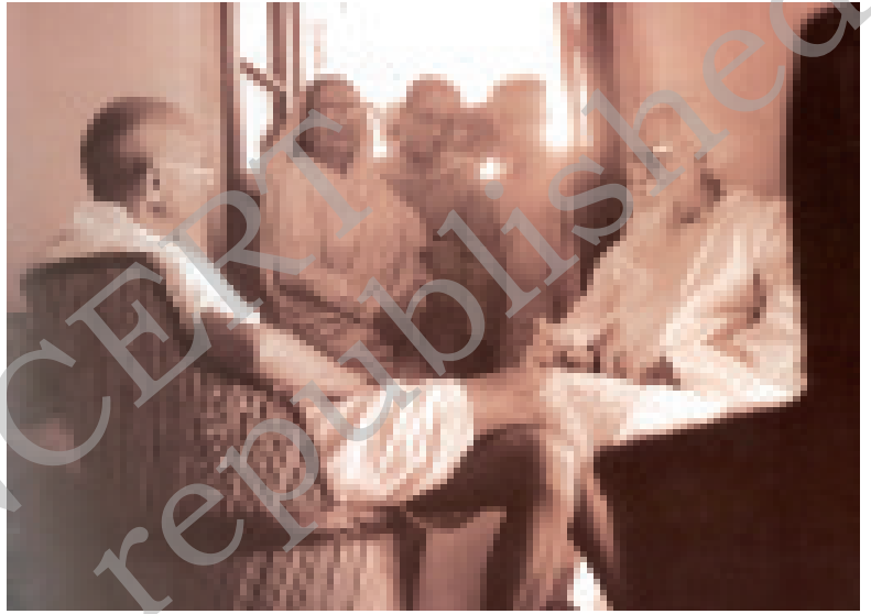
गांधी और टैगोर

विशिष्ट और प्रभावशाली व्यक्तित्व थे। उनकी समानताओं और विषमताओं की तुलना से हम बहुत कुछ सीख सकते हैं। कोई दो व्यक्ति अपनी बनावट और मिजाज में एक-दूसरे से इतने भिन्न नहीं हो सकते। टैगोर संभ्रांत कलाकार थे, जो सर्वहारा के प्रति सहानुभूति के कारण लोकतंत्रवादी हो गए थे। गांधी, जो विशेष रूप से जनता के आदमी थे, भारतीय किसान का साकार