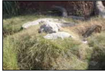
चित्र 8.12 : मगर