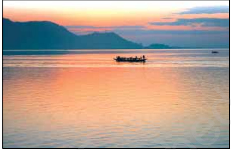
चित्र 8.7 : ब्रह्मपुत्र नदी

गंगा एवं ब्रह्मपुत्र के मैदान, पर्वत एवं हिमालय के गिरिपाद तथा सुंदरवन डेल्टा