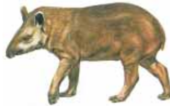
चित्र 8.4 : टैपीर

विभिन्न प्रजातियाँ भी इन वनों में पाई जाती हैं। मगर, साँप, अजगर तथा एनाकोंडा एवं बोआ कुछ ऐसी ही प्रजातियाँ हैं। इसके अतिरिक्त हज़ारों कीड़े-मकोड़े भी इस बेसिन में निवास करते हैं। मांस खाने वाली पिरान्या मत्स्य समेत मछलियों की विभिन्न प्रजातियाँ भी अमेज़न नदी में पाई जाती हैं। इस प्रकार जीवों की विविधता की दृष्टि से यह बेसिन असाधारण रूप से समृद्ध है।