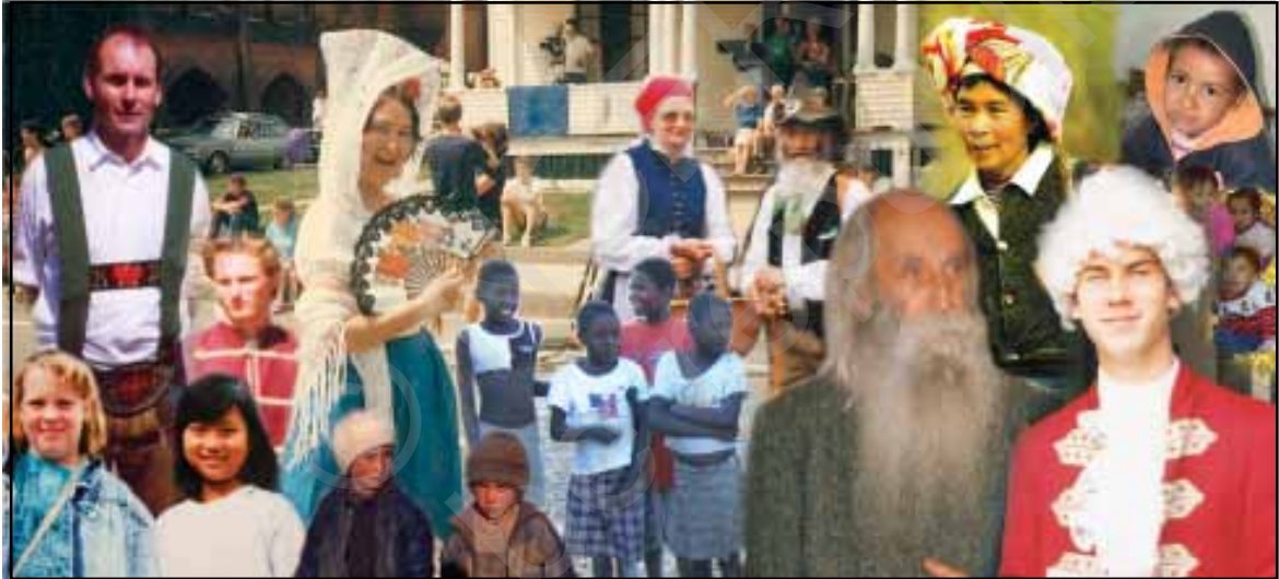
चित्र 8.11 : विश्व के विभिन्न भागों के निवासी

रेणुका बहुत उत्साहित थी। उसके चाचा श्रीकांत लगभग चार महीने के बाद आज घर में थे। वह एक वन्यजीव फोटोग्राफर थे तथा बहुत यात्रा करते थे। बहुत छोटी उम्र से ही रेणुका की रुचि वन्यजीव एवं वनों में थी जब उसके चाचा ने प्रकृति संबंधी पुस्तकों से उसका परिचय कराया। दूरस्थ भूस्थल एवं वहाँ रहने वाले लोगों की तसवीरें उसे हमेशा आकर्षित करती थी।