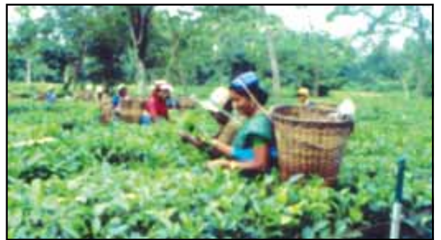
चित्र 8.10 : असम में चाय बागान