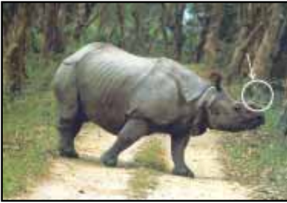
चित्र 8.11 : एक सींग वाला गैंडा

बेसिन में विविध प्रकार के वन्यजीव पाए जाते हैं। इनमें हाथी, बाघ, हिरण एवं बंदर आदि सामान्य रूप से पाए जाने वाले जीव हैं। एक सींग वाला गैंडा ब्रह्मपुत्र के मैदानों में पाया जाता है (चित्र 8.11)। डेल्टा क्षेत्र में बंगाल टाइगर, मगर एवं घड़ियाल पाए जाते हैं (चित्र 8.12)। नदी के साफ़ जल, झील एवं बंगाल की खाड़ी में प्रचुर मात्रा में जलीय जीव पाए जाते हैं। रोहू, कतला एवं हिलसा मछलियों की सबसे लोकप्रिय प्रजातियाँ हैं। मछली एवं चावल इस क्षेत्र में रहने वाले लोगों का मुख्य आहार है।