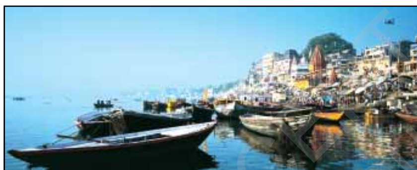
चित्र 8.13 : गंगा नदी के तट पर स्थित वाराणसी शहर

गंगा-ब्रह्मपुत्र के मैदानों में कई बड़े शहर एवं कस्बे स्थित हैं। इलाहाबाद, कानपुर, वाराणसी, लखनऊ, पटना एवं कोलकाता जैसे 10 लाख से अधिक आबादी वाले शहर गंगा नदी के तट पर ही स्थित हैं (चित्र 8.13)। इन शहरों तथा यहाँ स्थित उद्योगों का गंदा पानी बहकर नदी में ही जाता है जिससे नदी प्रदूषित होती है।