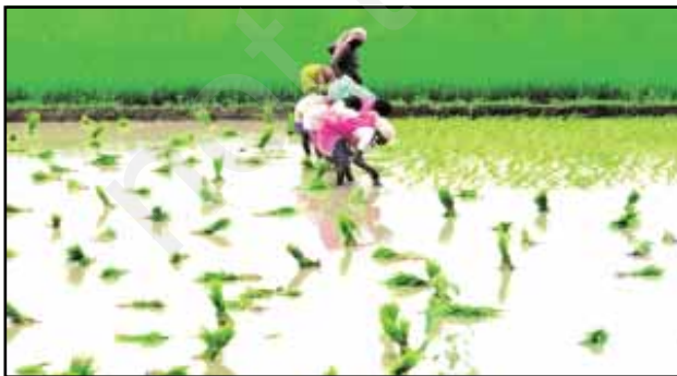
चित्र 8.9 : धान की कृषि

विभिन्न भू-आकृतियों के अनुसार वनस्पति में भी विभिन्नता पायी जाती है। गंगा-ब्रह्मपुत्र के मैदानों में सागवान, साखू एवं पीपल के साथ उष्णकटिबंधीय पर्णपाती पेड़ भी पाए जाते हैं। ब्रह्मपुत्र के मैदानी क्षेत्रों में घने बाँस के घने झुरमुट पाए जाते हैं। डेल्टा क्षेत्र मैंग्रोव वन से घिरा है। उत्तराखण्ड, सिक्किम एवं अरुणाचल प्रदेश की ठंडी जलवायु एवं तीव्र ढाल वाले भागों में चीड़, देवदार एवं फर जैसे शंकुधारी पेड़ पाए जाते हैं।