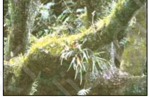
चित्र 8.3 : अमेज़न वन

इन प्रदेशों में अत्यधिक वर्षा के कारण यहाँ की भूमि पर सघन वन उग जाते हैं (चित्र 8.3)। वन इतने सघन होते हैं कि पत्तियों तथा शाखाओं से 'छत' सी बन जाती है जिसके कारण सूर्य का प्रकाश धरातल तक नहीं पहुँच पाता है। यहाँ की भूमि प्रकाश रहित एवं नम बनी रहती है। यहाँ केवल वही वनस्पति पनप सकती है जिसमें