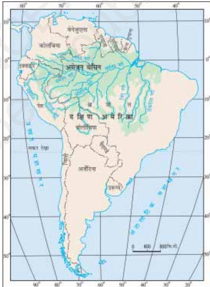
चित्र 8.2 : दक्षिण अमेरिका में अमेज़न बेसिन

क्या आप इस बेसिन में स्थित उन देशों के नाम बता सकते हैं जिनसे भूमध्य रेखा गुजरती है?