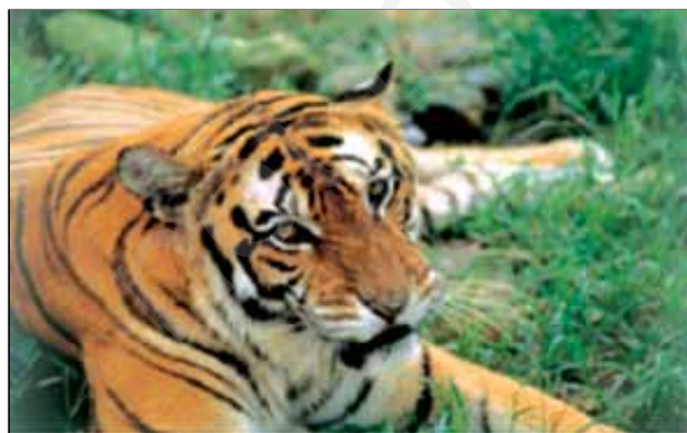
चित्र 8.14 : मानस वन्य प्राणी अभयवन में बाघ

बेसिन में यातायात का सुविकसित तंत्र उपस्थित है। आप देख सकते हैं कि गंगा-ब्रह्मपुत्र बेसिन में यातायात के चार मार्ग सुविकसित हैं। मैदानी इलाकों के लोग सड़कमार्ग एवं रेलमार्ग द्वारा एक स्थान से दूसरे स्थान तक जाते हैं। नदी के तटीय क्षेत्रों में जलमार्ग यातायात का प्रभावशाली माध्यम है। कोलकाता हुगली नदी पर स्थित एक महत्वपूर्ण पत्तन है। मैदानी क्षेत्र में कई बड़े हवाई पत्तन भी स्थित हैं।