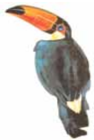
चित्र 8.4 : टूकन

वर्षावन में प्राणिजात की प्रचुरता होती है। टूकन, गुंजन पक्षी, रंगीन पक्षित वाले पक्षी एवं भोजन के लिए बड़ी चोंच वाले विभिन्न प्रकार के पक्षी जो भारत में पाए जाने वाले सामान्य पक्षियों से भिन्न होते हैं यहाँ पाए जाते हैं। प्राणियों में बंदर, स्लॉथ एवं चीटीं खाने वाले टैपीर भी यहाँ पाए जाते हैं। साँप एवं सरीसर्प की