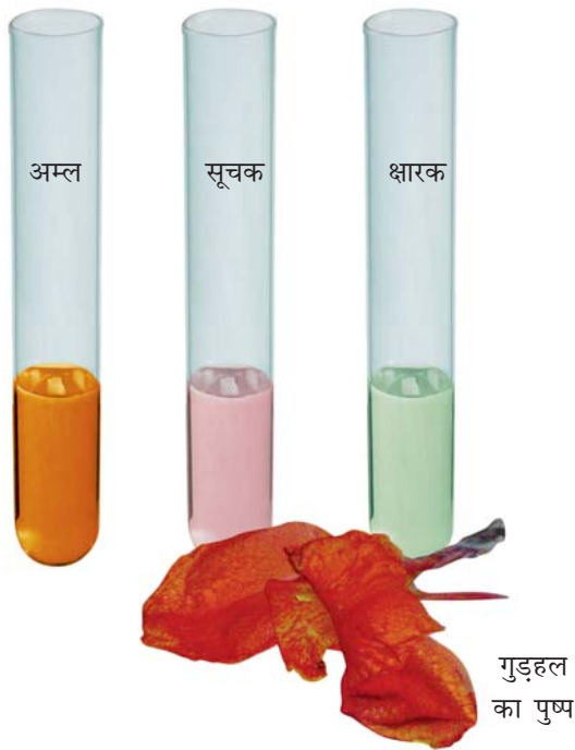
चित्र 5.3 गुड़हल का पुष्प और उससे तैयार किया गया सूचक

आप इन प्राकृतिक सूचकों को बनाकर उनसे अम्लीय, क्षारकीय और उदासीन विलयनों में रंग परिवर्तन देखने का प्रयास कर सकते हैं।