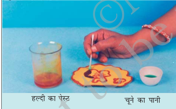
हल्दी का पेस्ट

आप अपनी माताजी के जन्मदिन पर, उनके लिए विशेष बधाई पत्र बना सकते हैं। सादे सफेद कागज़ की शीट पर हल्दी का पेस्ट लगाइए और उसे सुखा लीजिए। रुई के फाहे की सहायता से इस पर चूने के पानी से एक खूबसूरत फूल बनाइए। आपको एक सुंदर बधाई पत्र मिल जाएगा।