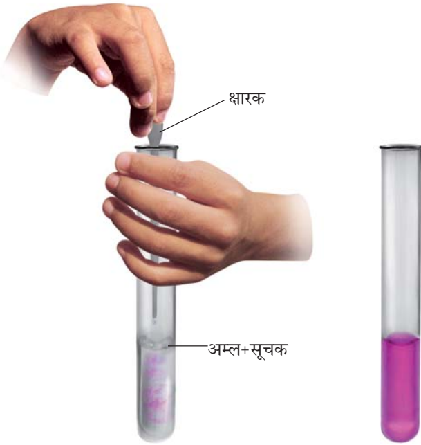
चित्र 5.4 उदासीनीकरण का प्रक्रम

(चित्र 5.4)। परखनली को धीरे-धीरे हिलाइए। क्या आपको अम्ल के रंग में कोई परिवर्तन दिखाई देता है?