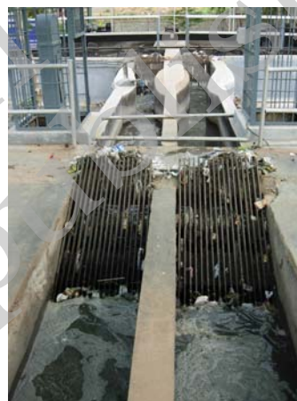
चित्र 18.3 शलाका छन्ने