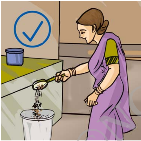
चित्र 18.7 हर कचरे को सिंक में मत फेंकिए

मल, स्वास्थ्य संकट का एक कारक है। इससे जल और मृदा का प्रदूषण हो सकता है। सतह पर उपलब्ध जल और भौमजल दोनों मानव मल से प्रदूषित हो जाते हैं। 'भौमजल' कुँओं, ट्यूबवैल (नलकूपों), झरनों और अनेक नदियों के लिए जल का स्रोत है, जैसा कि आपने अध्याय 16 में पढ़ा था। अतः अनुपचारित मानव मल, जल जनित रोगों का सबसे सुगम पथ बन जाता