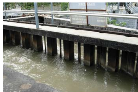
चित्र 18.4 ग्रिट और बालू अलग करने की टंकी