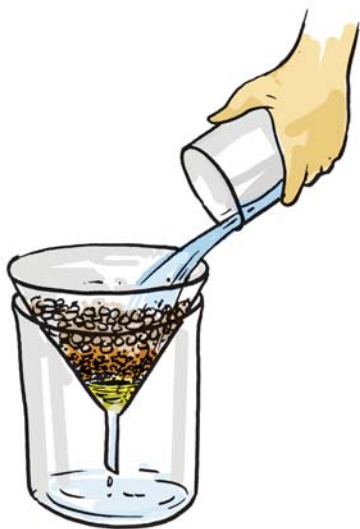
चित्र 18.2 वातित द्रव को फिल्टर करने का प्रक्रम