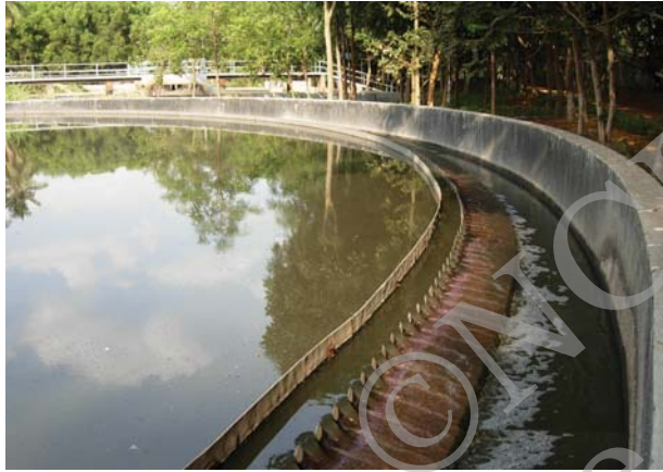
चित्र 18.5 जल अपमथित्र

आपंक को एक पृथक् टंकी में स्थानांतरित किया जाता है, जहाँ यह अवायवीय जीवाणुओं द्वारा अपघटित हो जाता है। इस प्रक्रम में उत्पन्न होने वाली बायोगैस (जैव गैस) का उपयोग ईंधन के रूप में अथवा विद्युत उत्पादन के लिए किया जा सकता है।