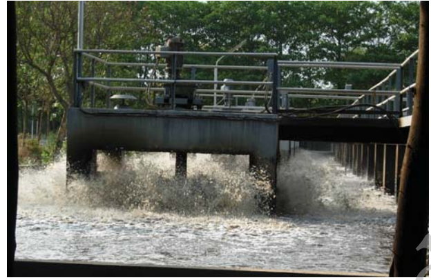
चित्र 18.6 वातित्र

कई घंटों के पश्चात् जल में निलंबित सूक्ष्मजीव टंकी की पेंदी में सक्रिय आपंक के रूप में बैठ जाते हैं। अब शीर्ष भाग से जल को निकाल दिया जाता है। सक्रिय आपंक लगभग 97% जल है। जल को बालू बिछाकर बनाए शुष्कन तलों अथवा मशीनों द्वारा हटा दिया जाता है। शुष्क आपंक का उपयोग खाद के रूप में किया जाता है, जिससे कार्बनिक पदार्थ और पोषक तत्व पुनः मृदा में वापस चले जाते हैं।