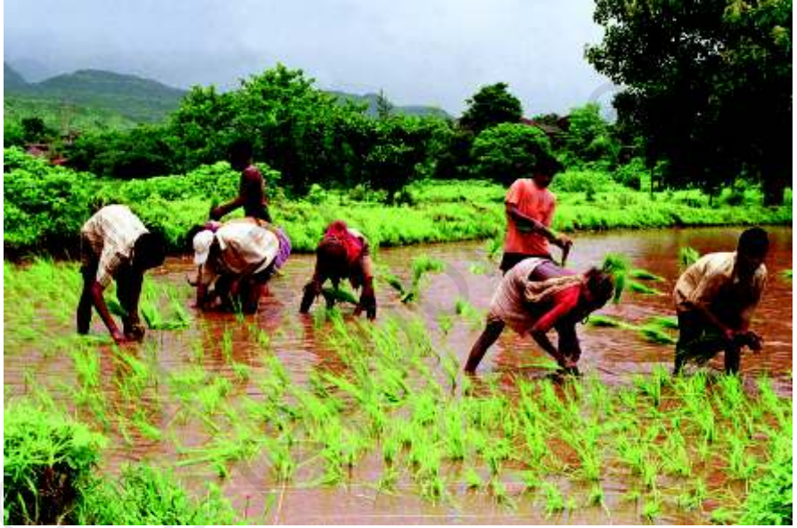
دھان کی روپائی کرنا کمر توڑ محنت کا کام ہے۔

کلپو تامل ناڈو کے سمندری ساحل کے نزدیک ایک گاؤں ہے۔ یہاں لوگ مختلف قسم کے کام کرتے ہیں۔ دوسرے گاؤں کی طرح یہاں بھی غیر کاشتی کام ہیں جیسے ٹوکریاں، برتن، گھڑے، اینٹیں اور نیل گاڑیاں وغیرہ بنانے کے کام۔ ایسے لوگ بھی ہیں جو مختلف قسم کی خدمات فراہم کرتے ہیں