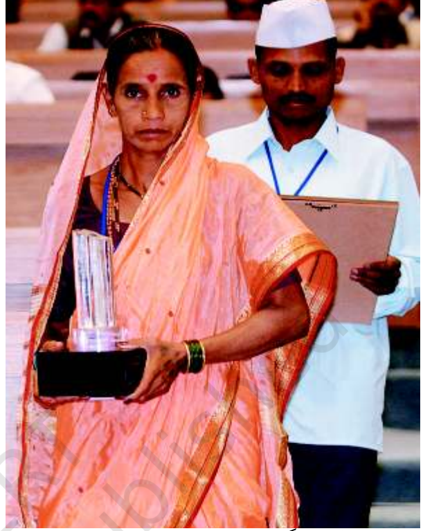
مہاراشٹر کے دو گرام پنچ جنہیں 2005ء میں پنچایت میں نہایت اچھا کام کرنے پر نرمل گرام پُرسکار سے نوازا گیا۔

گرام پنچایت میں کیا فیصلے ہوئے؟ کیا آپ کے خیال میں ان کے لیے ایسے فیصلے لینا ضروری تھا؟ اوپر کے بیان کی بنیاد پر ایک سوال تیار کیجیے جو گرام سبھا کی اگلی میٹنگ میں لوگ پنچایت سے پوچھ سکیں۔