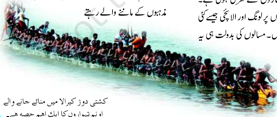
کشتی دوڑ کیرالا میں منائے جانے والے اونم تہواروں کا ایک اہم حصہ ہے۔

نے یورپ سے ہندوستان تک کا بحری راستہ دریافت کیا۔ ان تمام مختلف تاریخی اثرات کی وجہ سے کیرالا میں کئی مذہبوں کے ماننے والے رہتے