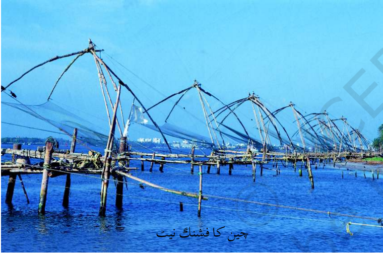
چین کا فیشنگ نیٹ

علاقہ تاجروں کے لیے کشش کا سبب بنا۔ سب سے پہلے یہاں یہودی اور عرب تاجر آئے۔ حضرت عیسیٰ کے