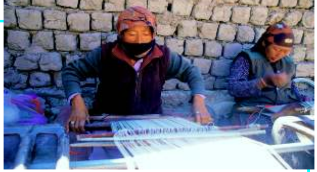
پشیمہ شال بنتے ہوئی ایک عورت

بہت سے عرب تاجر بھی یہاں آئے اور بس گئے۔ ابن بطوطہ نے جو تقریباً سات سو برس پہلے یہاں کے سفر پر آئے تھے، ایک سفر نامہ اس علاقے کے مسلمانوں کی زندگی کے بارے میں لکھا۔ اس میں یہاں کے مسلمانوں کی زندگی کا بیان ہے اور لکھا ہے کہ مسلم طبقہ بہت معزز مانا جاتا ہے۔ پھر واسکو ڈی گاما کے جہاز کے یہاں پہنچنے کے ساتھ پرتگالیوں