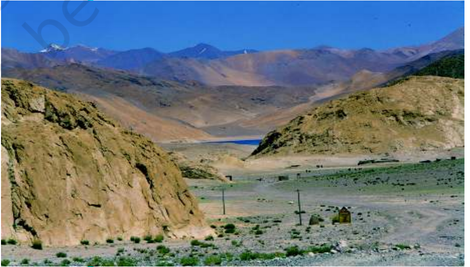
لداخ کے پہاڑی ریگستان کا بنجر اور خشک علاقہ

آئیے جاننے کی کوشش کریں جب ہم کہتے ہیں کہ کسی خطے کے تاریخی اور جغرافیائی عوامل اور عناصر وہاں کے تنوع پر اثر انداز ہوتے ہیں تو اس کا مطلب کیا ہے۔ ہم اپنے ملک کے دو الگ الگ حصوں کیرالا اور لداخ کے بارے میں پڑھ کر یہ معلوم کر سکتے ہیں۔