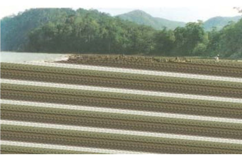
चित्र 7.4 : प्रवाल द्वीप