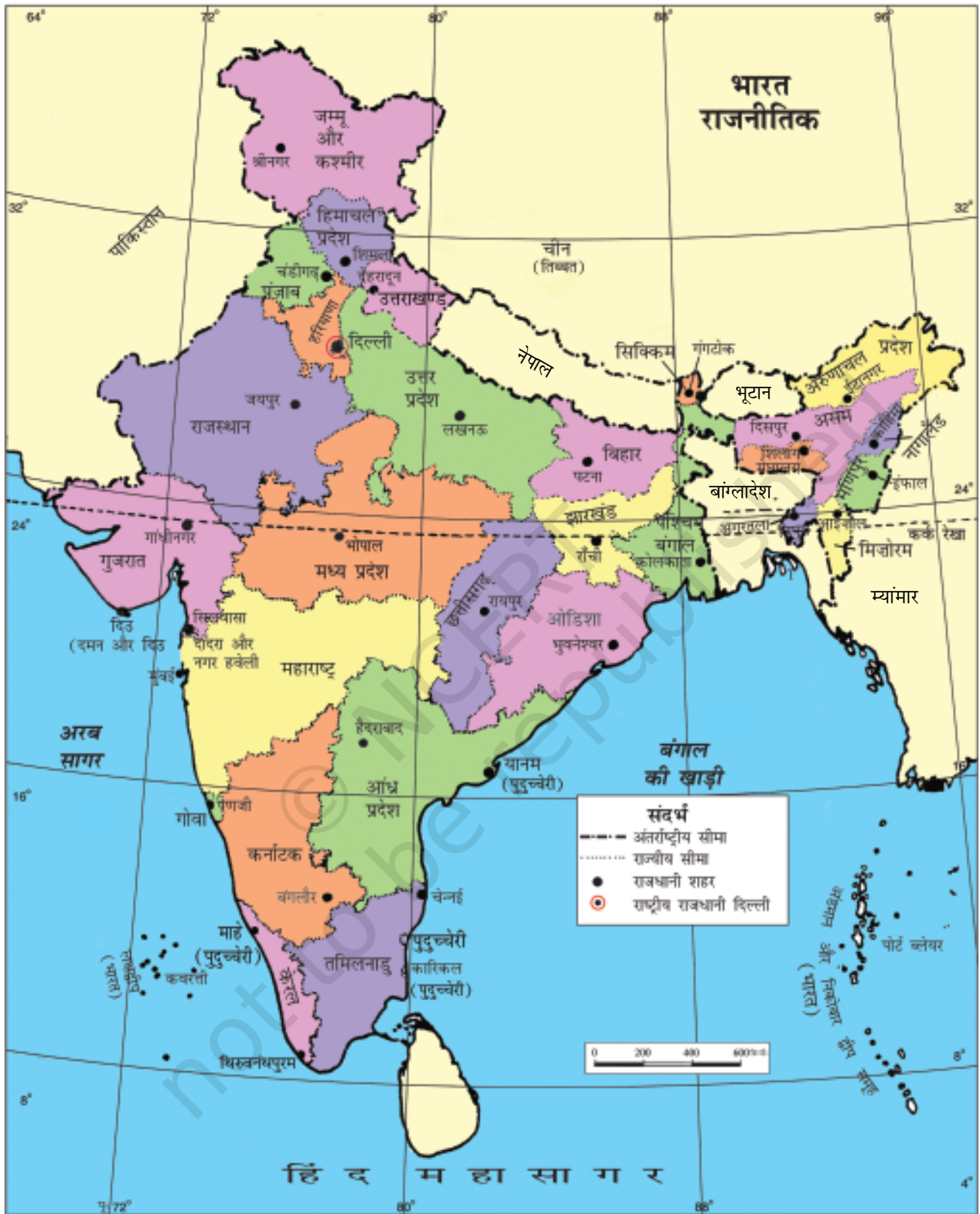
चित्र 7.2 : भारत का राजनीतिक मानचित्र