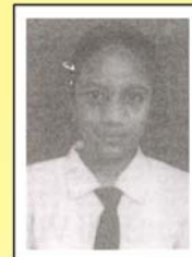
पंखुड़ी विद्या कक्षा VIII B