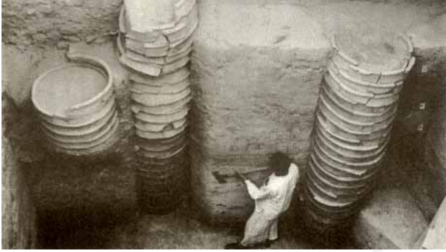
दिल्ली में मिला वलयकूप। हड़प्पा की जल निकास व्यवस्था से यह कैसे भिन्न है?

अध्याय 6 में वर्णित अनेक शहर, महाजनपदों की राजधानी थे। जैसा कि तुमने पढ़ा इनमें से कुछ शहर परकोटों से घिरे होते थे।