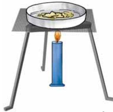
चित्र 6.9 मोम को गर्म करना

क्या मोमबत्ती की लंबाई में परिवर्तन को उत्क्रमित किया जा सकता है? यदि हम कुछ मोम बर्तन में लें और गर्म करें तो क्या इस परिवर्तन को उत्क्रमित किया जा सकता है (चित्र 6.9)?