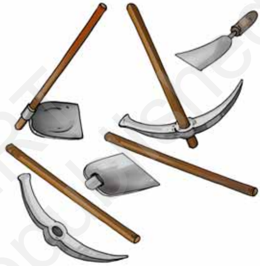
चित्र 6.6 लकड़ी के हथ्थे लगाने से पहले औज़ार प्रायः गर्म किए जाते हैं

हम सभी ने मिट्टी को खोदने वाले औज़ार देखे होंगे (चित्र 6.6)। क्या आपने इन औज़ारों में देखा है कि लोहे के फलक को कैसे एक लकड़ी के हथ्थे पर जड़ दिया जाता है?