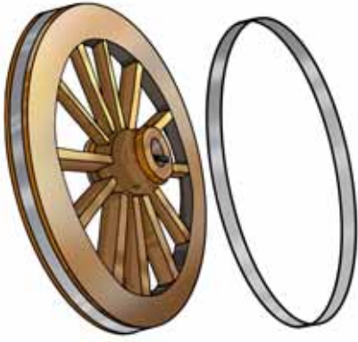
चित्र 6.7 धातु रिम जड़ित बैलगाड़ी का पहिया

चढ़ जाता है। अब पहिए के किनारे के ऊपर ठंडा पानी डालते हैं जिससे रिम ठंडा हो जाता है तथा पहिए के ऊपर कस जाता है।