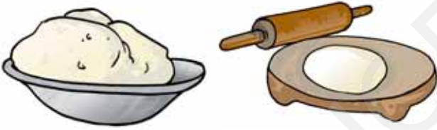
चित्र 6.3 गूंधे हुए आटे की लोई और बेली गई रोटी

गूंधे हुए आटे की एक लोई बनाइए। इससे रोटी बेलने की कोशिश कीजिए (चित्र 6.3)। शायद आप इसके आकार से खुश न हों और इस रोटी को दुबारा लोई में परिवर्तित करना चाहेंगे।