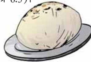
चित्र 6.5 एक रोटी

गूंधे हुए आटे की लोई से रोटी बेलकर उसे तवे पर सेंकिए (चित्र 6.5)।