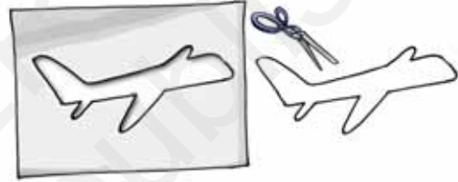
चित्र 6.4 कागज से काटकर बनाया गया हवाई जहाज

अब वही कागज का टुकड़ा लीजिए जिसे क्रियाकलाप 2 में आपने प्रयोग किया है। उसके ऊपर एक हवाई जहाज का रेखाचित्र बनाइए तथा उसे बाहरी रेखा के साथ-साथ काटिए (चित्र 6.4)।