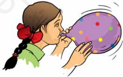
चित्र 6.1 गुब्बारे में हवा भरने से उसके आमाप और आकार में परिवर्तन हो जाता है

एक गुब्बारा लीजिए और उसे फुलाइए। सावधानी बरतें कि वह फट न जाए। गुब्बारे का आकार एवं आमाप बदल गया है (चित्र 6.1)। अब उसकी हवा निकल जाने दें।