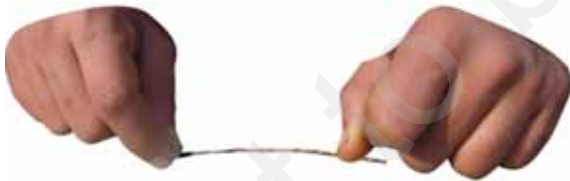
चित्र 3.4 तागे को पतले तंतुओं में विखंडित करना

किसी सूती कपड़े के टुकड़े से कोई तागा बाहर निकालिए। इस तागे के टुकड़े को मेज़ पर रखिए। इस तागे के टुकड़े के एक सिरे को अपने अंगूठे से दबाइए। तागे के दूसरे सिरे को इसकी लंबाई के अनुदिश, चित्र 3.4 में दर्शाए अनुसार अपने नाखून से खरोँचिए। क्या आप इस सिरे पर यह देखते हैं कि तागा पतली लड़ियों में विखंडित हो गया है (चित्र 3.5)?