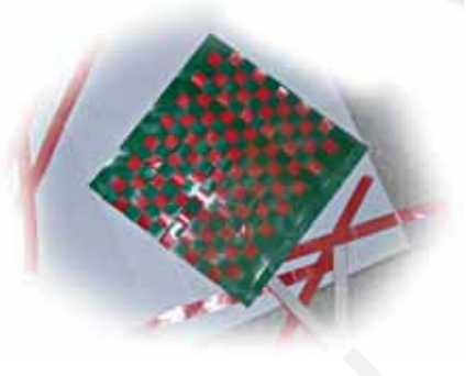
चित्र 3.12 कागज़ की पट्टियों से बुनाई

से चित्र 3.12(c) में दिखाए अनुसार बुनिए। चित्र 3.12 (d) में पट्टियों के बुनने के पश्चात का नमूना दिखाया गया है।