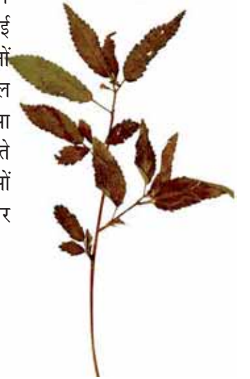
चित्र 3.8 पटसन पादप

वस्त्र बनाने से पहले इन सभी तंतुओं को तागों में परिवर्तित कर लिया जाता है। ऐसा कैसे किया जाता है?