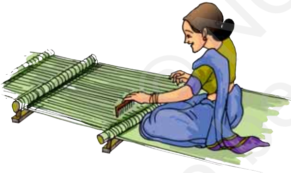
चित्र 3.13 हथकरघा

इसी ढंग से तागों के दो सेटों को बुनकर वस्त्र बुने जाते हैं। तागे वास्तव में कागज़ की पट्टियों की तुलना में बहुत पतले होते हैं। वस्त्रों की बुनाई करघों पर की जाती है (चित्र 3.13)। करघे या तो हस्तप्रचालित होते हैं अथवा विद्युतप्रचालित।