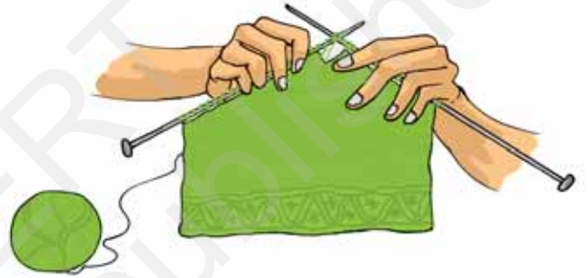
चित्र 3.14 स्वेटर बुनाई

क्या कभी आपने यह ध्यान से देखा है कि स्वेटर किस प्रकार बुने जाते हैं? इनकी बुनाई (निटिंग) में किसी एकल तागे का उपयोग वस्त्र के एक टुकड़े को बनाने में किया जाता है (चित्र 3.14)। क्या आपने कभी किसी फटे हुए मोजे के किसी तागे को खींचकर देखा है? जब आप ऐसा करते हैं तब क्या होता है? एकल धागा लगातार खिंचता चला आता है तथा वस्त्र उधड़ता जाता है। मोजे और बहुत-सी अन्य पहनने की