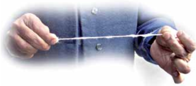
चित्र 3.9 रूई से तागा बनाना