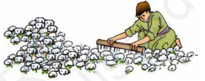
चित्र 3.7 कपास ओटना

पारंपरिक ढंग से कपास हाथों से ओटी जाती थी (चित्र 3.7)। आजकल कपास ओटने के लिए मशीनों का उपयोग भी किया जाता है।