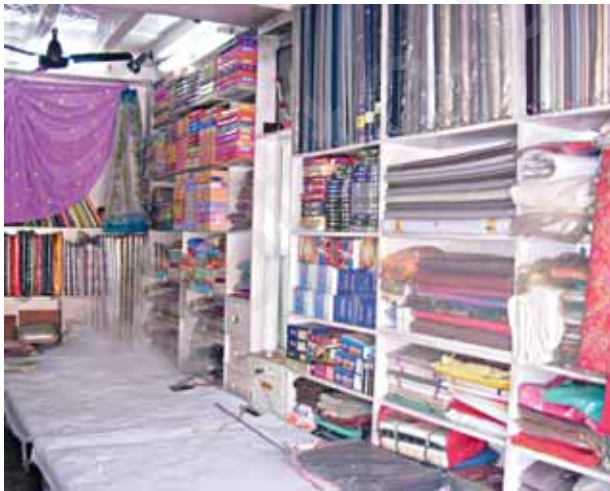
चित्र 3.1 कपड़े की दुकान

कपड़े की दुकान का भ्रमण करने के पश्चात पहेली और बूझो ने अपने आस-पास में विभिन्न प्रकार के वस्त्रों को ध्यान से देखना आरंभ कर दिया। उन्होंने यह देखा कि बेडशीट (बिस्तर पर बिछाने की चादर),