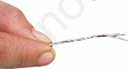
चित्र 3.5 तागा पतली लड़ियों में विखंडित हो जाता है

सुई में तागे को पिरोने (डालने) का प्रयास करते समय भी आपने ऐसा ही प्रेक्षण किया होगा। कई बार तागे का यह सिरा कुछ पतली लड़ियों में पृथक हो जाता है। ऐसा होने पर तागे को सुई के नाके से गुजारना कठिन हो जाता है। तागे की ये दिखाई देने वाली पतली लड़ियाँ भी और अधिक पतली लड़ियों से मिलकर बनी होती हैं, जिन्हें तंतु कहते हैं।