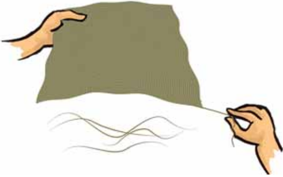
चित्र 3.3 कपड़े से कोई तागा या तंतु खींचना

तागा दिखाई न दे तो पिन अथवा सुई की सहायता से आप एक तागा धीरे-धीरे बाहर खींच सकते हैं। हम यह देखते हैं कि तागों को एक साथ व्यवस्थित करने पर वस्त्र बना है। ये तागे किससे बनते हैं?