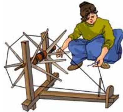
चित्र 3.11 चरखा

कताई के लिए एक सरल युक्ति 'हस्त तकुआ' का उपयोग किया जाता है जिसे तकली कहते हैं (चित्र 3.10)। हाथ से प्रचालित कताई में उपयोग होने वाली एक अन्य युक्ति चरखा है (चित्र 3.11)। चरखे के उपयोग को राष्ट्रपिता महात्मा गाँधी ने स्वतंत्रता आंदोलन के एक पक्ष के रूप में लोकप्रियता प्रदान की थी। उन्होंने लोगों को हाथ कते तागों से बुने वस्त्रों को पहनने तथा ब्रिटेन की मिलों में बने आयातित कपड़ों का बहिष्कार करने के लिए प्रोत्साहित किया था।