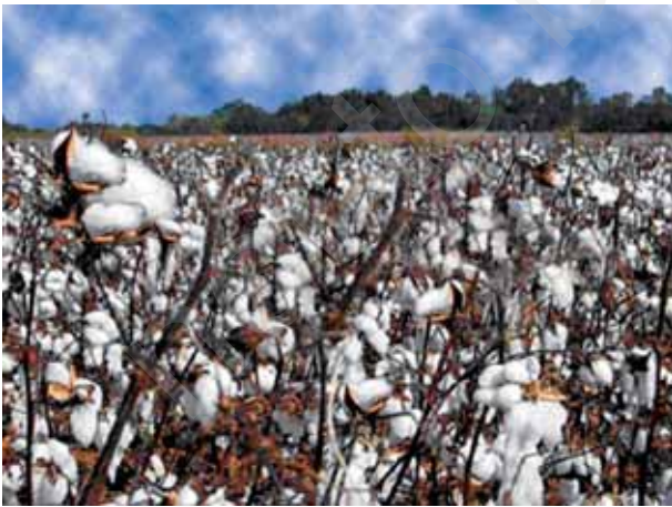
चित्र 3.6 कपास पादप के खेत

रुई कहाँ से आती है? इसे खेतों में उगाया जाता है। साधारणतया कपास के पौधे वहाँ उगाए जाते हैं जहाँ की मृदा काली तथा जलवायु उष्ण होती है। क्या आप ऐसे कुछ राज्यों के नाम बता सकते हैं जहाँ हमारे देश में कपास की कृषि की जाती है? कपास पादप के फल (कपास गोलक) लगभग नींबू की माप के होते हैं। पूर्ण परिपक्व होने पर बीज टूटकर खुल जाते हैं तथा अब कपास तंतुओं से ढके बिनौले (कपास बीज) को देखा जा सकता है। क्या आपने ऐसा कपास-खेत देखा है जो कपास चुने जाने के लिए तैयार हो चुका है? इस समय खेत कपास के परिफुल्लों (रोवों) से इतना श्वेत हो जाता है जैसे हिम ने ढक लिया हो (चित्र 3.6)।