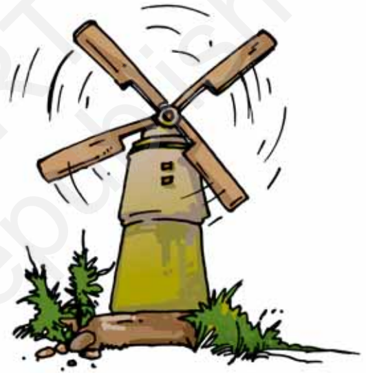
चित्र 15.12 पवन-चक्की

अब हम यह अनुभव कर सकते हैं कि पृथ्वी पर जीवन के लिए वायु अत्यंत महत्वपूर्ण है। क्या वायु के कुछ अन्य उपयोग भी हैं? क्या आपने पवन-चक्की के बारे में सुना है? चित्र 15.12 को देखिए।