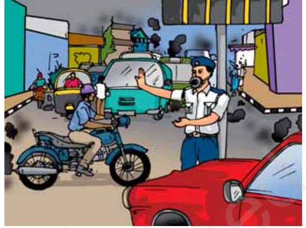
चित्र 15.8 भीड़ भरे चौराहे पर एक पुलिसकर्मी द्वारा मुखौटा पहनकर यातायात नियंत्रण

बूझो आपसे यह पूछ रहा है कि चित्र 15.8 में पुलिसकर्मी ने मुखौटा क्यों पहना है?