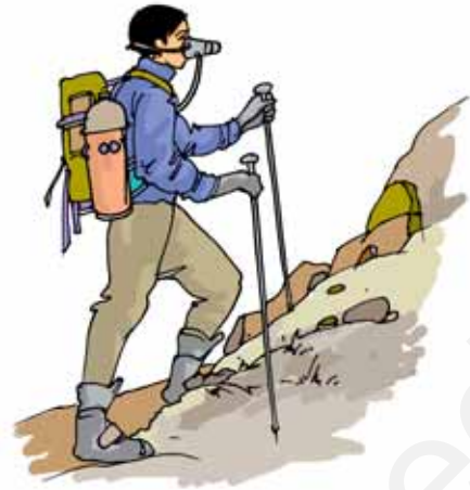
चित्र 15.5 पर्वतारोही अपने साथ ऑक्सीजन का सिलिंडर ले जाते हैं

पर्वतारोही ऊँचे पर्वतों पर चढ़ते समय ऑक्सीजन का सिलिंडर अपने साथ क्यों ले जाते हैं (चित्र 15.5)?