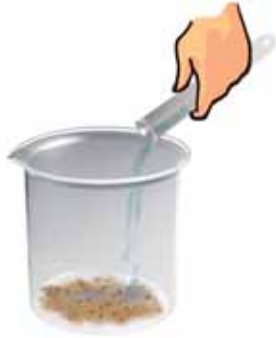
चित्र 15.11 मिट्टी में वायु होती है

लिए इसी वायु का उपयोग करते हैं। मिट्टी के जीव गहरी मिट्टी में बहुत-सी माँद तथा छिद्र बना लेते हैं। इन छिद्रों के द्वारा वायु को अंदर व बाहर जाने के लिए जगह उपलब्ध हो जाती है। लेकिन जब भारी वर्षा हो जाती है तो इन छिद्रों एवं माँदों में वायु की जगह पानी भर जाता है। इस स्थिति में ज़मीन के अंदर रहने वाले जीवों को साँस लेने के लिए ज़मीन पर आना पड़ता है। क्या यही कारण है कि केंचुए केवल भारी वर्षा के समय पर ही ज़मीन से बाहर आते हैं?