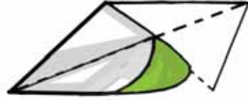
चित्र 15.2 एक साधारण फिरकी बनाना

फिरकी की डंडी को पकड़िए और उसे एक खुले क्षेत्र में भिन्न-भिन्न दिशाओं में रखिए। इसे थोड़ा