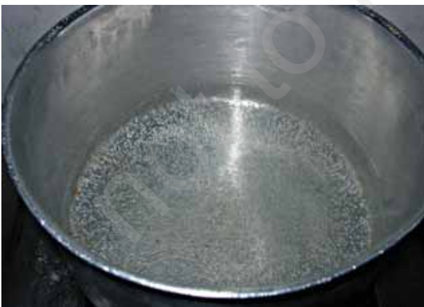
चित्र 15.10 जल में वायु विद्यमान होती है

बीकर या किसी काँच के बर्तन में थोड़ा पानी लीजिए। इसको त्रिपाद स्टैंड के ऊपर रखकर धीरे-धीरे गर्म करें। पानी के उबलने से पहले सावधानीपूर्वक पात्र