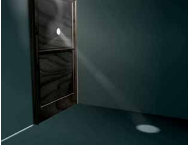
चित्र 15.7 वायु में धूल के कणों की उपस्थिति का सूर्य के प्रकाश में अवलोकन

क्या आप यह देखते हैं कि सूर्य की किरणों में कुछ छोटे-छोटे चमकीले कण तेज़ी से घूम रहे हैं (चित्र 15.7)? ये कण क्या हैं?