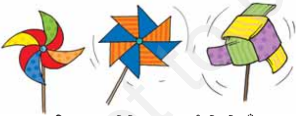
चित्र 15.1 विभिन्न प्रकार की फिरकियाँ

क्या आप कभी फिरकी से खेले हैं (चित्र 15.1)?