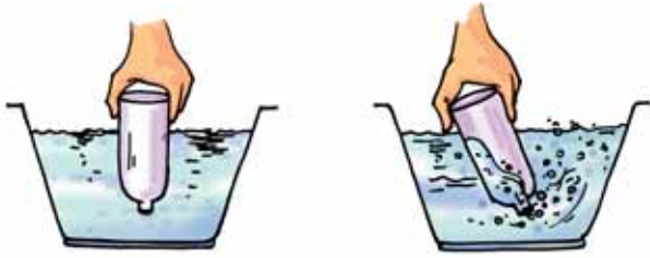
चित्र 15.4 एक खाली बोतल से प्रयोग

अब बोतल के खुले मुख को पानी से भरी हुई बाल्टी में चित्र 15.4 के अनुसार डुबोएँ। बोतल को ध्यान से देखिए। क्या पानी बोतल के अंदर प्रवेश करता है? अब बोतल को थोड़ा-सा तिरछा कीजिए। क्या अब पानी बोतल में प्रवेश करता है? क्या आप बोतल में से कुछ बुलबुले बाहर आते देखते हैं या बुदबुदाहट सुनाई देती है? क्या अब आप अनुमान लगा सकते हैं कि बोतल के अंदर क्या था?