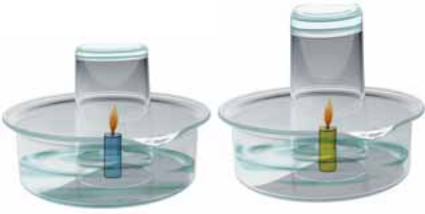
चित्र 15.6 वायु में ऑक्सीजन है

एक-एक गिलास उलटकर रख दें। (एक गिलास दूसरे से बड़ा हो)। ध्यानपूर्वक देखिए कि जलती हुई मोमबत्तियों और पानी की सतह को क्या हुआ?