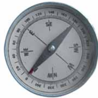
चित्र 13.10 कंपास

तत्पश्चात् चुंबकों के इस गुण पर आधारित एक युक्ति विकसित हुई। यह कंपास (दिक्सूचक) के नाम से जानी जाती है। कंपास सामान्यतः काँच के ढक्कन वाली एक छोटी डिब्बी होती है। एक चुंबकित सुई डिब्बी के अंदर एक धुरी पर लगी होती है जो स्वतंत्रतापूर्वक घूमती है (चित्र 13.10)। कंपास में एक डायल भी होता है जिसपर दिशाएँ अंकित होती हैं। कंपास को उस स्थान पर रखते हैं जहाँ हमें दिशा निर्धारण करना होता है। इसकी सुई विरामावस्था में उत्तर-दक्षिण दिशा को निर्देशित करती है। कंपास को तब तक घुमाते हैं जब तक कि डायल पर अंकित उत्तर-दक्षिण के चिह्न, सुई के दोनों सिरे पर न आ जाएँ। चुंबकीय सुई के उत्तरी ध्रुव की पहचान के लिए सामान्यतः इसे भिन्न रंग से पेंट किया जाता है।