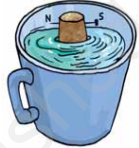
चित्र 13.12 प्याले में एक कंपास

इसे पानी से भरे प्याले अथवा टब में तैराइए। यह सुनिश्चित कीजिए कि सुई पानी को न छुए (चित्र 13.12)। अब आपकी कंपास कार्य करने के लिए तैयार है। तैरती कॉर्क पर लगी सुई की दिशा नोट कीजिए। सुई लगी कॉर्क को