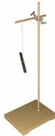
चित्र 13.9 स्वतंत्रतापूर्वक लटका चुंबक सदैव एक ही दिशा में आकर रुकता है।

एक छड़ चुंबक लीजिए। इसके एक सिरे पर पहचान के लिए एक चिह्न लगाइए। अब एक धागे को चुंबक के मध्य बिंदु से बाँधिए जिससे कि इसे एक लकड़ी के स्टैंड पर लटका सकें (चित्र 13.9)। यह सुनिश्चित कीजिए कि चुंबक प्रत्येक दिशा में स्वतंत्रतापूर्वक घूम सके। इसे विराम अवस्था में आने दीजिए। चुंबक की विरामावस्था में इसके दोनों सिरों की स्थिति दर्शाने के लिए धरती पर दो बिंदु चिह्नित कीजिए। इन बिंदुओं को एक रेखा से मिलाइए। यह रेखा उस दिशा को दर्शाती है, जिस दिशा में चुंबक अपनी विरामावस्था