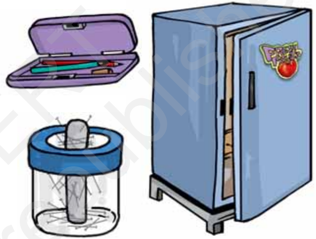
चित्र 13.2 कुछ सामान्य वस्तुएँ जिनमें चुंबक होते हैं

व्यवस्था के बिना भी जब हम ढक्कन बंद करते हैं तो यह कसकर बंद हो जाता है। ऐसे चिपकू, पिनधारकों तथा पेंसिल बॉक्सों में चुंबक लगे होते हैं (चित्र 13.2)।