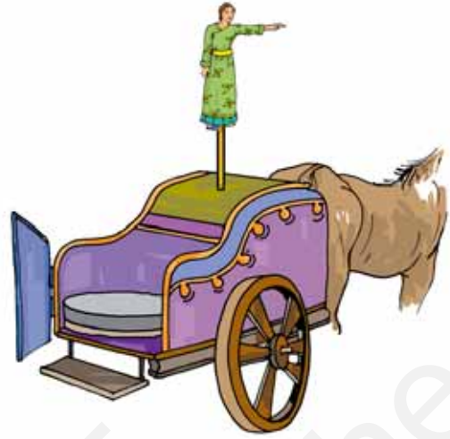
चित्र 13.8 दिशा दिखलाते हुए मूर्ति वाला रथ