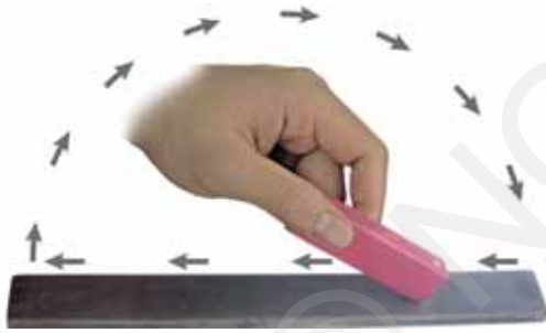
चित्र 13.11 अपना स्वयं का चुंबक बनाना

चुंबक बनाने की अनेक विधियाँ हैं। आइए, हम सरलतम विधि सीखें। लोहे का एक आयताकार टुकड़ा लीजिए। इसे मेज़ पर रखिए। अब एक छड़ चुंबक लीजिए तथा इसका कोई एक ध्रुव लोहे की छड़ के एक सिरे पर रखिए। चुंबक को बिना हटाए इसे लोहे की छड़ के दूसरे सिरे तक ले जाइए। चुंबक को उठाइए तथा उसी ध्रुव को लोहे के टुकड़े के प्रारंभिक सिरे पर वापस ले आइए (चित्र 13.11)। इसी प्रकार चुंबक को लोहे की छड़ के अनुदिश बार-बार ले जाइए। इस प्रक्रिया को लगभग 30-40 बार दोहराइए। जाँच कीजिए कि क्या लोहे की छड़ चुंबक बन गई है। इसके लिए कोई पिन अथवा लोहे का बुरादा