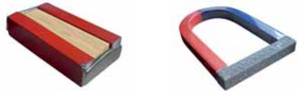
चित्र 13.16 अपनी चुंबकों का सुरक्षित भंडारण कीजिए

यदि चुंबकों का उचित रख रखाव न हो तब भी ये समय के साथ क्षीण हो जाते हैं। छड़ चुंबकों को सुरक्षित रखने के लिए उनके जोड़ों के असमान ध्रुवों को पास-पास रखा जाना चाहिए। इन चुंबकों को लकड़ी के टुकड़े से पृथक करके इनके सिरों पर नर्म लोहे के दो टुकड़े लगाने चाहिए। (चित्र 13.16)।