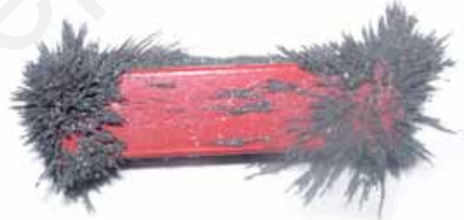
चित्र 13.7 छड़ चुंबक से चिपका लोहे का बुरादा

एक कागज़ की शीट पर लोहे का बुरादा फैलाइए। इस शीट के ऊपर एक छड़ चुंबक रखिए। आप क्या देखते हैं? क्या लोहे का बुरादा चुंबक के सभी स्थानों पर एक समान रूप से चिपकता है? क्या आप चुंबक के किसी भाग में किसी अन्य भाग से अधिक लोहे का बुरादा चिपका हुआ देखते हैं (चित्र 13.7)? चुंबक से