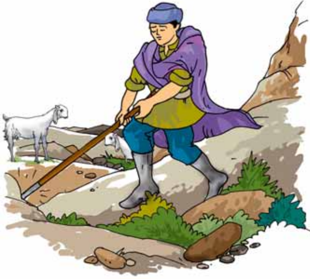
चित्र 13.3 एक पहाड़ी पर प्राकृतिक चुंबक

प्रतीत हो रही थी। यह चट्टान एक प्राकृतिक चुंबक थी और इसने गड़रिए की छड़ी की लोहे की टोपी को अपनी ओर आकर्षित कर लिया था। कहा जाता है कि इस प्रकार प्राकृतिक चुंबक की खोज हुई। संभवतः उस गड़रिए के नाम पर उस पत्थर को मैग्नेटाइट नाम दिया गया। मैग्नेटाइट में लोहा होता है। कुछ लोगों का विश्वास है कि यह मैग्नेटाइट, मैग्नेशिया नामक स्थान पर सबसे पहले पाया गया था। जिन पदार्थों में लोहे को आकर्षित करने का गुण पाया जाता है वे चुंबक कहलाते हैं।