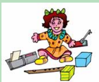
चित्र 13.17 एक बुद्धिमान गुड़िया