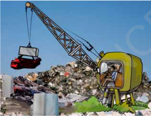
चित्र 13.1 कबाड़ के ढेर से लोहे के टुकड़ों का चयन

पहेली तथा बूझो ऐसे स्थान पर गए, जहाँ अपशिष्ट (कूड़ा-कबाड़) पदार्थ के बड़े-बड़े ढेर थे। कुछ प्रोत्साहक घटना घट रही थी। कूड़े के ढेर की ओर एक क्रेन जा रही थी। क्रेन ने इस ढेर की ओर एक गुटके को नीचे किया। फिर वह गुटका ऊपर उठने लगा। अनुमान कीजिए, यहाँ क्या हुआ? बेकार पुराने लोहे के बहुत से टुकड़े गुटके के साथ चिपककर क्रेन के साथ जाने लगे (चित्र 13.1)!