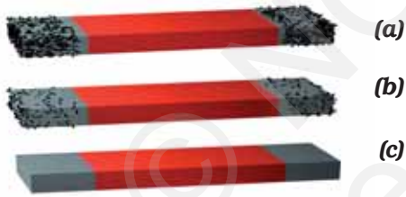
चित्र 13.6 चुंबक (a) पर्याप्त लोहे के बुरादे के साथ (b) कुछ बुरादे के साथ (c) बिना बुरादे के साथ

आपने जो ज्ञात किया है उसकी एक सारणी बनाइए।