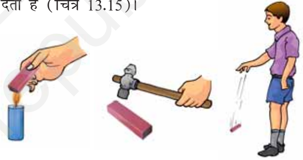
चित्र 13.15 चुंबक गर्म करने पर, हथौड़े से पीटने पर और ऊँचाई से गिराने पर अपने गुण खो देते हैं।

यदि चुंबक को गर्म किया जाए, हथौड़े से पीटा जाए या ऊँचाई से गिराया जाए तो वह अपने गुण खो देता है (चित्र 13.15)।