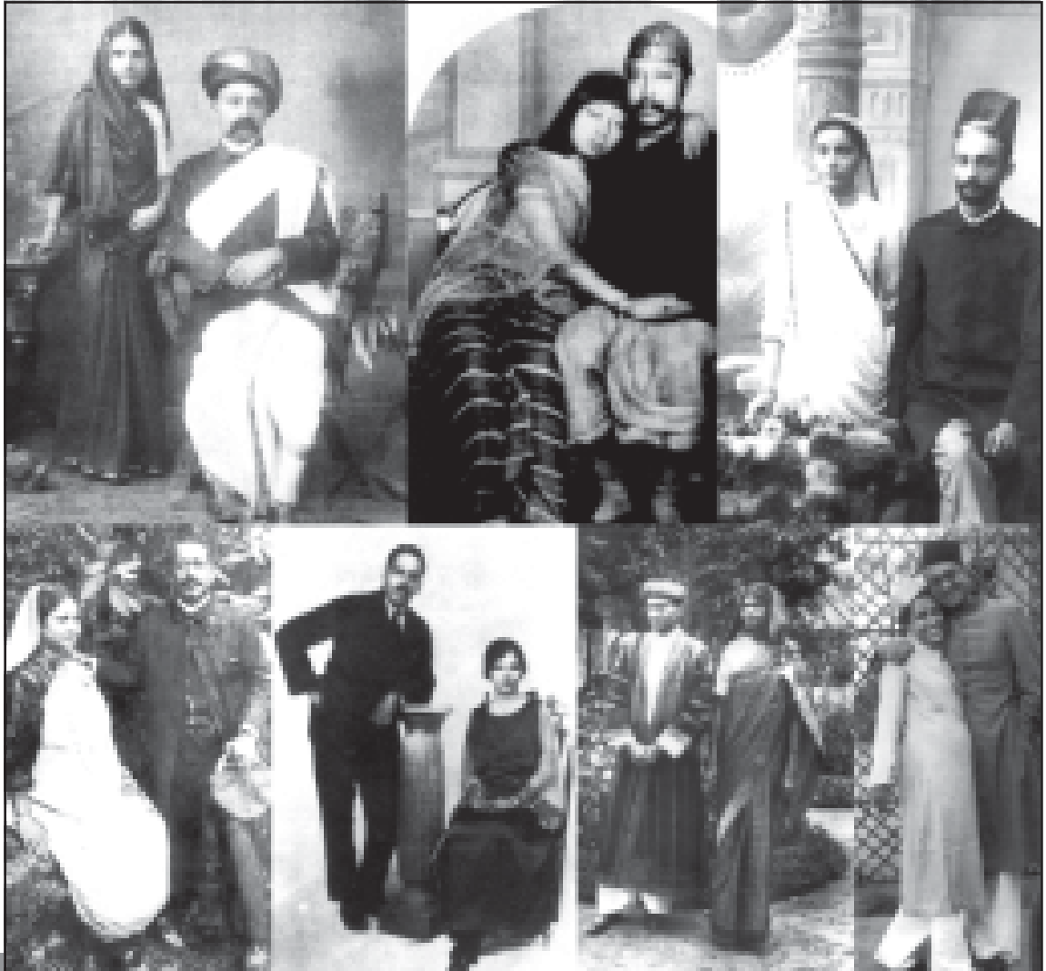
1880 से 1930 के दौरान विभिन्न क्षेत्रों के दंपती: सबसे ऊपर बाएँ कोने से: गुजरात; त्रिपुरा; मुंबई; अलीगढ़; हैदराबाद; गोवा; कोलकाता।

क्षेत्रीय भावनाओं को आदर देना मात्र ही राज्य निर्माण के लिए काफ़ी नहीं है, बल्कि इसके लिए एक ऐसा संस्थागत ढाँचा होना भी जरूरी है जो यह सुनिश्चित कर सके कि वह एक बड़े संघीय ढाँचे के