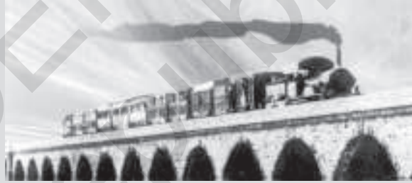
भारत में पहले क्रीक पुल जो कि थाणे के पास है। उसके ऊपर से गुजरती हुई रेलगाड़ी-1854

1861 और 1878 के बीच, 269 वर्ग मील का विस्तृत जंगल आरक्षित घोषित कर दिया गया। सन् 1894 तक यह क्षेत्र 3683 वर्गमील का हो गया। और यह बढ़ते-बढ़ते 19वीं सदी के अंत तक 20061 वर्ग मील का हो गया, (जिसमें कुल प्रांत का 42.2 प्रतिशत क्षेत्रफल था) इसमें से 3,609 वर्ग मील को आरक्षित रखा गया था। इसमें गौर करने की बात यह है कि जंगल का वो बड़ा क्षेत्र जिसमें आदिवासी समुदायों का निवास था और जो सदियों से वहाँ जीवनयापन करते आए थे, भी प्रशासकीय नियंत्रण में आ गया। पहाड़ी क्षेत्रों में आदिवासी जनजातीय समुदाय जंगलों से संबद्ध होकर प्रकृति के साथ मैत्रीपूर्ण जीवन जीते थे।