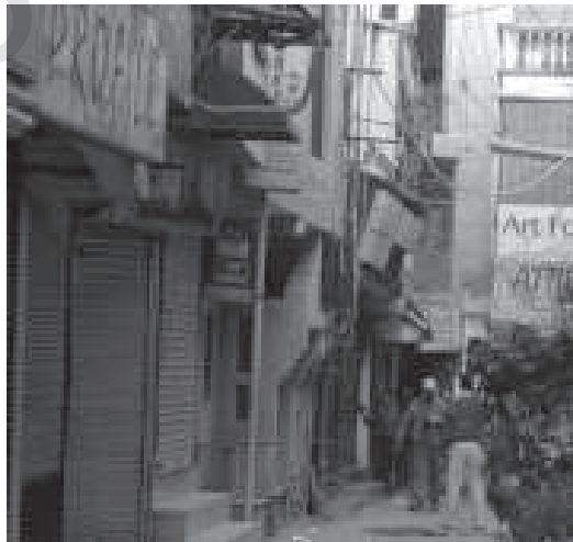
एक नगरीय गाँव का दृश्य