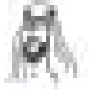
शेख पैट्रो डॉलर-उल्ला काला सोना मुल्क के सुल्तान

बेशकीमती चीजों की मैं कद्र करता हूँ। बिग ऑयल कहते हैं कि उनके राष्ट्रपति आजादी और जम्हूरियत को बड़ा कीमती मानते हैं इसीलिए मैंने भी अपने मुल्क में आजादी और जम्हूरियत को सात तालों के भीतर बंद करके रखा है।