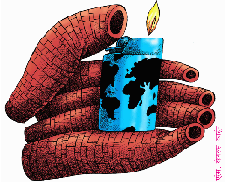
ऐसे, कैल्स कार्टून

हालाँकि पर्यावरण से जुड़े सरोकारों का लंबा इतिहास है लेकिन आर्थिक विकास के कारण पर्यावरण पर होने वाले असर की चिंता ने 1960 के दशक के बाद से राजनीतिक चरित्र ग्रहण किया। वैश्विक मामलों से सरोकार रखने वाले एक विद्वत् समूह 'क्लब ऑव रोम' ने 1972 में 'लिमिट्स टू ग्रोथ' शीर्षक से एक पुस्तक प्रकाशित की। यह पुस्तक दुनिया की