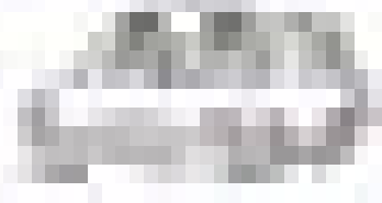
श्री एवं श्रीमती बड़बोले