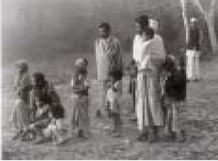
चित्र 14.11 बिहार में एक दंगा पीड़ित गाँव के लोग महात्मा गाँधी की प्रतीक्षा कर रहे हैं।