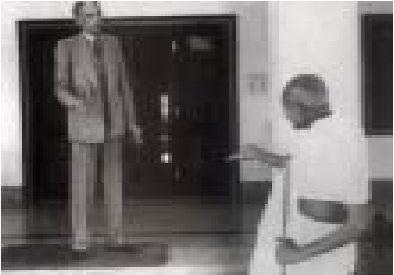
चित्र 14.6 नवंबर 1939 में वायसराय के साथ बैठक से पहले महात्मा गाँधी के साथ मोहम्मद अली जिन्ना।

मुसलमान थे। अंग्रेज़ यूनियनिस्टों को नाराज़ नहीं करना चाहते थे क्योंकि पंजाब सरकार में उन्हीं का दबदबा था और वे अंग्रेज़ों के प्रति लगातार वफ़ादार रहे थे।