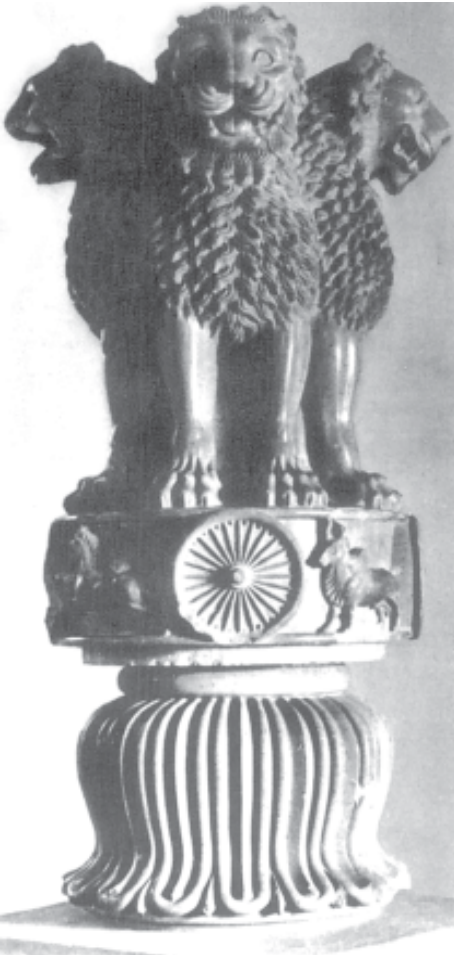
चित्र 2.3 सिंह शीर्ष

असोक के अधिकांश अभिलेख प्राकृत में हैं जबकि पश्चिमोत्तर से मिले अभिलेख अरामेइक और यूनानी भाषा में हैं। प्राकृत के अधिकांश अभिलेख ब्राह्मी लिपि में लिखे गए थे जबकि पश्चिमोत्तर के कुछ अभिलेख खरोष्ठी में लिखे गए थे। अरामेइक और यूनानी लिपियों का प्रयोग अफगानिस्तान में मिले अभिलेखों में किया गया था।