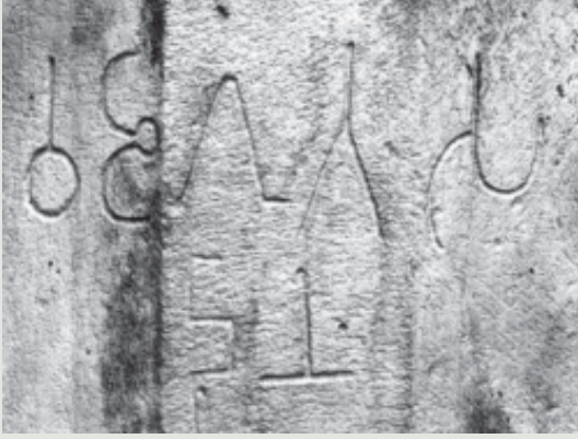
चित्र 2.1 एक अभिलेख, साँची (मध्य प्रदेश), लगभग द्वितीय शताब्दी ई.

हड़प्पा सभ्यता के बाद डेढ़ हजार वर्षों के लंबे अंतराल में उपमहाद्वीप के विभिन्न भागों में कई प्रकार के विकास हुए। यही वह काल था जब सिंधु नदी और इसकी उपनदियों के किनारे रहने वाले लोगों द्वारा ऋग्वेद का लेखन किया गया। उत्तर भारत, दक्कन पठार क्षेत्र और कर्नाटक जैसे उपमहाद्वीप के कई क्षेत्रों में कृषक बस्तियाँ अस्तित्व में आईं। साथ ही दक्कन और दक्षिण भारत के क्षेत्रों में चरवाहा बस्तियों के प्रमाण भी मिलते हैं। ईसा पूर्व पहली सहस्राब्दि के दौरान मध्य और दक्षिण भारत में शवों के अंतिम संस्कार के नए तरीके भी सामने आए, जिनमें महापाषाण के नाम से ख्यात पत्थरों के बड़े-बड़े ढाँचे मिले हैं। कई स्थानों पर पाया गया है कि शवों के साथ विभिन्न प्रकार के लोहे से बने उपकरण और हथियारों को भी दफनाया गया था।