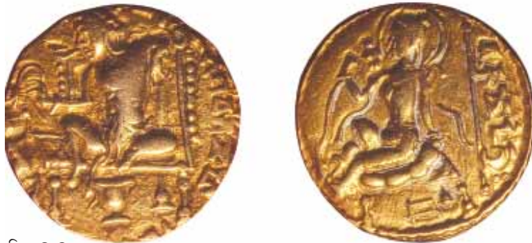
चित्र 2.9 एक गुप्त सिक्का

अभी तक हम अन्य बातों के अलावा अभिलेखों के अंशों के बारे में अध्ययन कर रहे थे। लेकिन इतिहासकारों को यह कैसे ज्ञात होता है कि अभिलेखों पर क्या लिखा है?