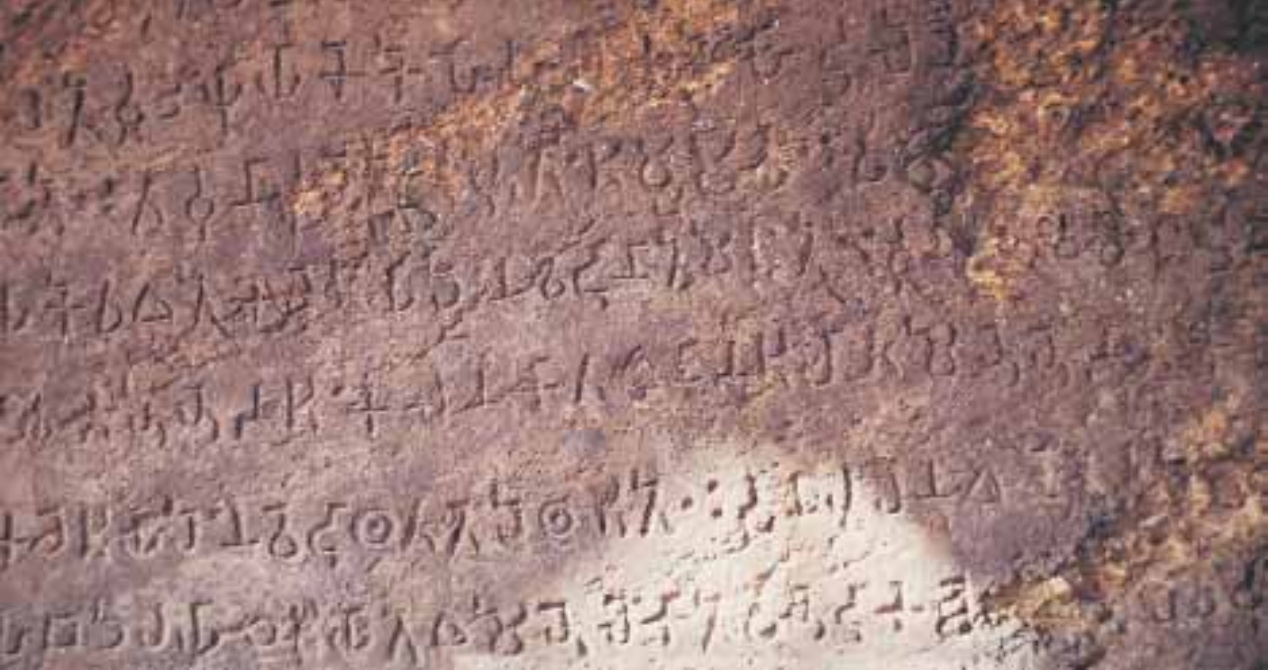
चित्र 2.10 असोक का एक अभिलेख