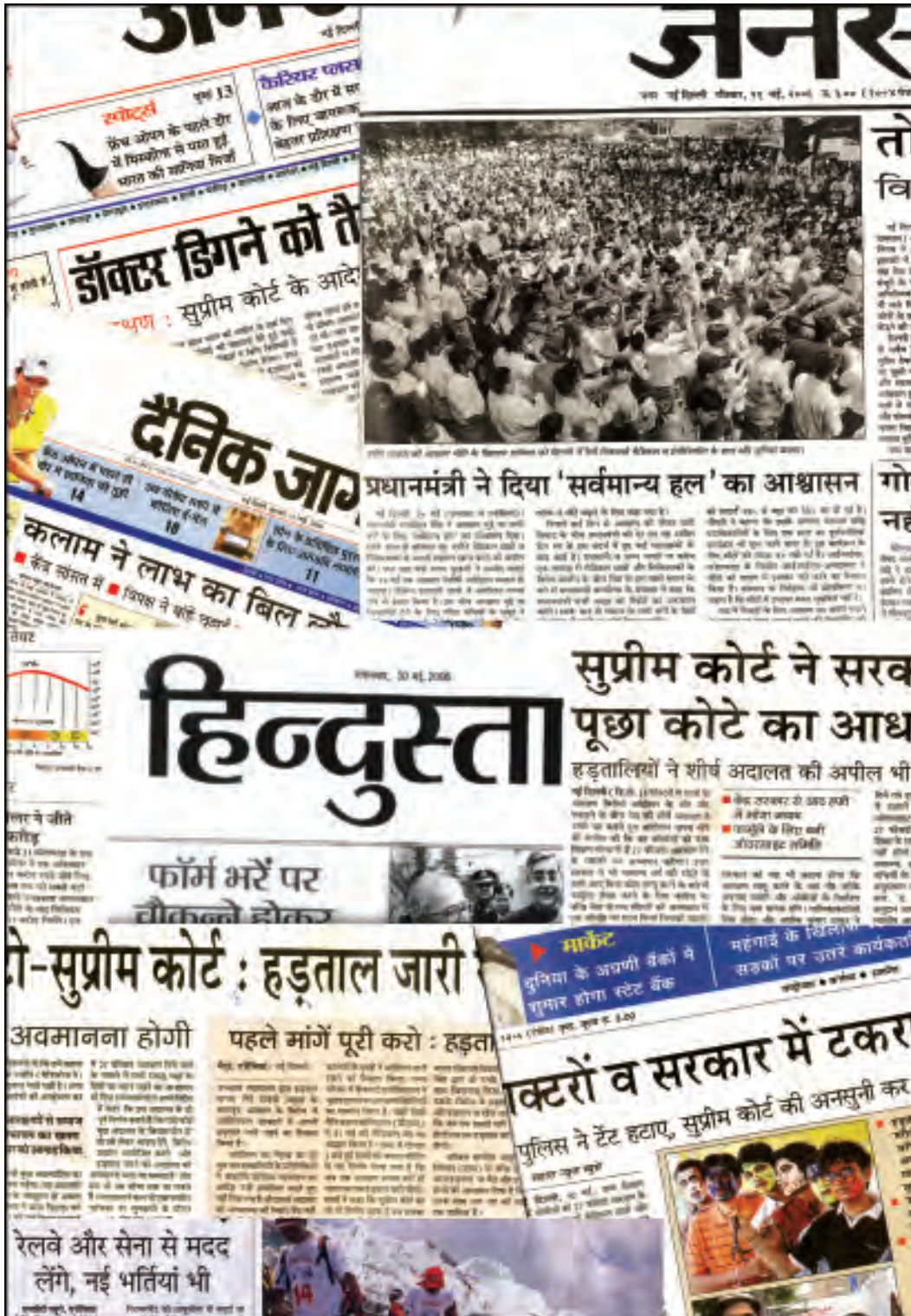
कुछ वर्तमान समाचारपत्रों का एक कोलाज