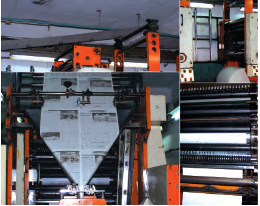
लेखन से छापेखाने तक

मुद्रित माध्यमों के तहत अखबार, पत्रिकाएँ, पुस्तकें आदि हैं। हमारे दैनिक जीवन में इनका कितना महत्त्व है, यह दोहराने की ज़रूरत नहीं है। मुद्रित माध्यमों की सबसे बड़ी विशेषता या शक्ति यह है कि छपे हुए शब्दों में स्थायित्व होता है। उसे आप आराम से और धीरे-धीरे पढ़ सकते हैं। पढ़ते हुए उस पर सोच सकते हैं। अगर कोई बात समझ में नहीं आई तो उसे दोबारा या जितनी बार इच्छा करे, उतनी बार पढ़ सकते हैं।