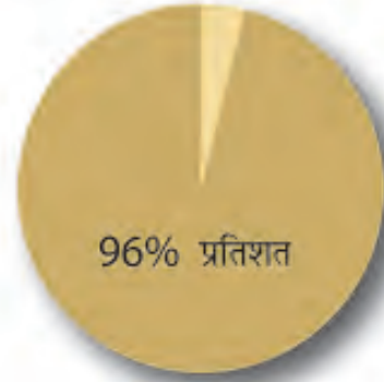
जनता के बीच आकाशवाणी का दायरा

आज टेलीविज़न जनसंचार का सबसे लोकप्रिय और ताकतवर माध्यम बन गया है। प्रिंट मीडिया के शब्द और रेडियो की ध्वनियों के साथ जब टेलीविज़न के दृश्य मिल जाते हैं तो सूचना