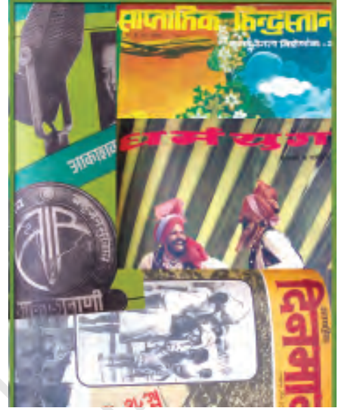
अतीत की कुछ प्रमुख पत्रिकाएँ

जनसंचार की सबसे मज़बूत कड़ी पत्र-पत्रिकाएँ या प्रिंट मीडिया ही है। हालाँकि अपने विशाल दर्शक वर्ग और तीव्रता के कारण रेडियो और टेलीविज़न की ताकत ज्यादा मानी जा सकती है लेकिन वाणी को शब्दों के रूप में रिकार्ड करने वाला आरंभिक माध्यम होने की वजह से प्रिंट मीडिया का महत्त्व हमेशा बना रहेगा। आज भले ही प्रिंट, रेडियो, टेलीविज़न या इंटरनेट, किसी भी माध्यम से खबरों के संचार को पत्रकारिता कहा जाता हो, लेकिन आरंभ में केवल प्रिंट माध्यमों के ज़रिये खबरों के आदान-प्रदान को ही पत्रकारिता कहा जाता था। इसके तीन पहलू हैं—पहला समाचारों को संकलित करना, दूसरा उन्हें संपादित कर छपने लायक बनाना और तीसरा पत्र या पत्रिका के रूप में छापकर पाठक तक पहुँचाना। हालाँकि तीनों ही काम आपस में गहरे जुड़े हैं लेकिन पत्रकारिता के तहत हम पहले दो कामों को ही लेते हैं क्योंकि प्रकाशन और वितरण का कार्य तकनीकी और प्रबंधकीय विभागों के अधीन होते हैं जबकि रिपोर्टिंग और संपादन के काम के लिए एक विशेष बौद्धिक और पत्रकारीय कौशल की अपेक्षा होती है।