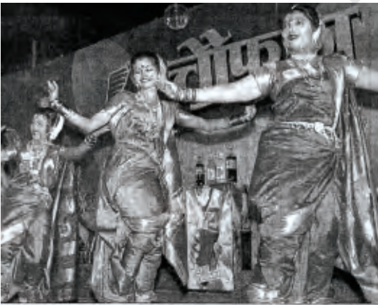
महाराष्ट्र का लावनी नृत्य

जनभावनाओं को राजदरबार तक पहुँचाने और राजा का संदेश जनता के बीच प्रसारित करने की समृद्ध व्यवस्थाओं के उदाहरण बाद में भी दिखाई पड़ते हैं। चंद्रगुप्त मौर्य, अशोक जैसे सम्राटों के शासन-काल में स्थायी महत्त्व के संदेशों के लिए शिलालेखों और सामयिक या तात्कालिक संदेशों के लिए कच्ची स्याही या रंगों से संदेश लिखकर प्रदर्शित करने की व्यवस्था और मजबूत हुई। तब बाकायदा रोज़नामचा लिखने के लिए कर्मचारी नियुक्त किए जाने लगे और जनता के बीच संदेश भेजने के लिए भी सही व्यवस्था की गई।