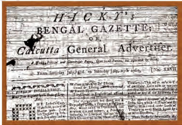
1780 में प्रकाशित होने वाला भारत का पहला अखबार

लेकिन जहाँ आज़ादी से पहले पत्रकारिता का लक्ष्य स्वाधीनता की प्राप्ति था, वहीं आज़ादी के बाद पत्रकारिता का लक्ष्य बदलने लगा। शुरुआती दो दशकों तक पत्रकारिता राष्ट्र-निर्माण के प्रति प्रतिबद्ध दिखती थी। लेकिन उसके बाद उसका चरित्र व्यावसायिक और प्रोफेशनल होने लगा। यही कारण है कि कुछ लोग कहते हैं कि आज़ादी से पहले पत्रकारिता एक मिशन थी लेकिन आज़ादी के