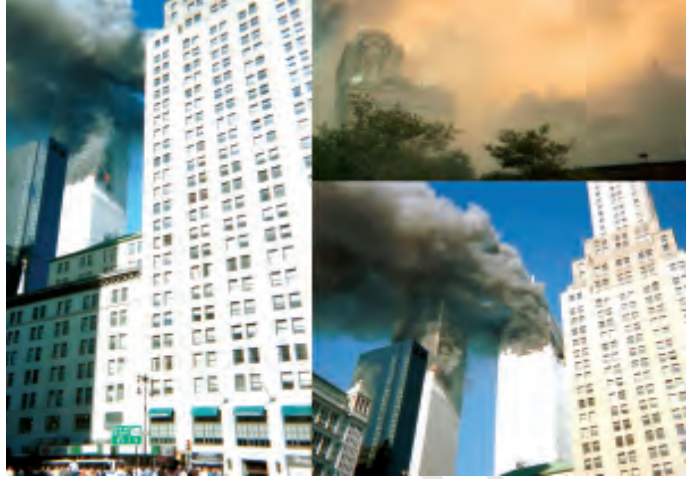
वर्ल्ड ट्रेड सेंटर पर आतंकवादी हमला

दुनिया के किसी भी कोने में कोई घटना हो, जनसंचार माध्यमों के ज़रिये कुछ ही मिनटों में हमें खबर मिल जाती है। अगर वहाँ किसी टेलीविज़न समाचार चैनल का संवाददाता मौजूद हो तो हमें वहाँ की तसवीरें भी तुरंत देखने को मिल जाती हैं। याद कीजिए 11 सितंबर 2001 को अमेरिका में वर्ल्ड ट्रेड सेंटर पर आतंकवादी हमले को पूरी दुनिया ने अपनी आँखों के सामने घटते देखा। इसी तरह आज टेलीविज़न के परदे पर हम दुनियाभर के अलग-अलग क्षेत्रों में घट रही घटनाओं को सीधे प्रसारण के ज़रिये ठीक उसी समय देख सकते हैं। आप क्रिकेट मैच देखने स्टेडियम भले न जाएँ लेकिन आप घर बैठे उस मैच का सीधा प्रसारण ( लाइव ) देख सकते हैं।