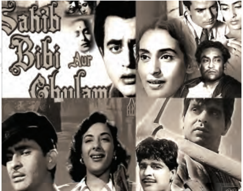
पुरानी फिल्मों के कुछ चित्र

जनसंचार का सबसे लोकप्रिय और प्रभावशाली माध्यम है—सिनेमा। हालाँकि यह जनसंचार के अन्य माध्यमों की तरह सीधे तौर पर सूचना देने का काम नहीं करता लेकिन परोक्ष रूप में सूचना, ज्ञान और संदेश देने का काम करता है। सिनेमा को मनोरंजन के एक सशक्त माध्यम के तौर पर देखा जाता रहा है।