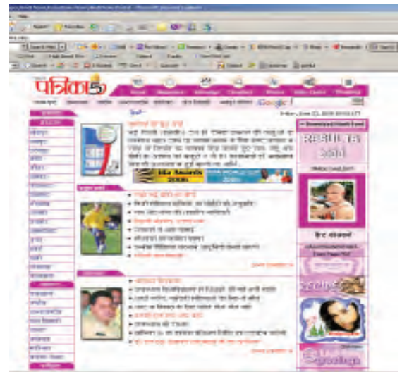
इंटरनेट पर पत्रिकाएँ

यह एक अंतरक्रियात्मक माध्यम है यानी आप इसमें मूक दर्शक नहीं हैं। आप सवाल-जवाब, बहस-मुबाहिसों में भाग