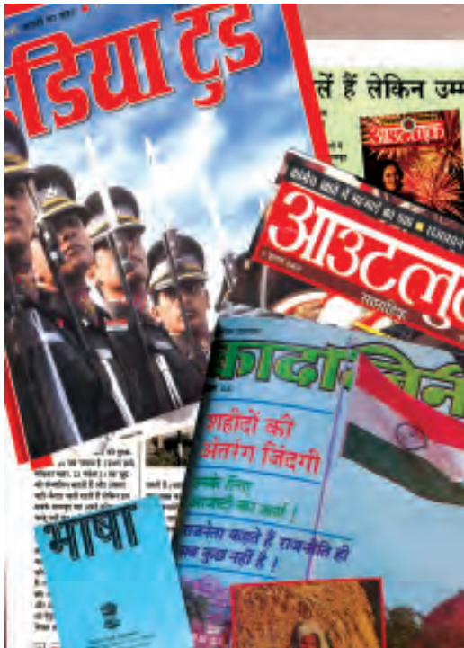
वर्तमान की कुछ प्रमुख पत्रिकाएँ

जहाँ बाहर से खबरें लाने का काम संवाददाताओं का होता है, वहीं तमाम खबरों, लेखों, फ़ीचरों को व्यवस्थित तरीके से संपादित करने और सुरुचिपूर्ण ढंग से छापने का काम संपादकीय विभाग में काम करनेवाले संपादकों का होता है। आज पत्रकारिता का क्षेत्र भी बहुत व्यापक हो चला है। खबर का संबंध किसी एक या दो विषयों से नहीं होता। दुनिया के किसी भी कोने की घटना समाचार बन सकती है बशर्ते कि उसमें पाठकों की दिलचस्पी हो या उसमें सार्वजनिक हित निहित हो।