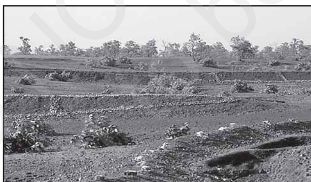
चित्र 12.4 : साझी संपदा संसाधन पर वृक्षारोपण स्रोत : मूल्यांकन रिपोर्ट, राजीव गांधी मिशन फॉर जलसंभर प्रबंधन, मध्य प्रदेश, 2002

झबुआ जिला मध्य प्रदेश के अति पश्चिमी कृषि जलवायु क्षेत्र में अवस्थित है। यह वास्तव में हमारे देश के सर्वाधिक पाँच पिछड़े जिलों में से एक है। जनजातीय जनसंख्या विशेषतः भील का उच्च सांद्रण इसकी विशेषता है। लोग गरीबी के कारण कष्ट झेल रहे हैं, और यह गरीबी जंगल एवं भूमि दोनों संसाधनों के उच्च दर से निम्नीकरण के कारण प्रबलित हो गई है। यहाँ भारत सरकार के 'ग्रामीण विकास' तथा 'कृषि मंत्रालय' दोनों ही से जल संभरण प्रबंधन कार्यक्रम फंड अनुदानित हैं, जिन्हें झबुआ जिले में सफलतापूर्वक क्रियान्वित किया गया है। यह निम्नीकरण को रोकने तथा भूमि की गुणवत्ता को सुधारने में सफल सिद्ध होगा। जल संभरण प्रबंधन कार्यक्रम भूमि, जल तथा वनस्पतियों के बीच संबद्धता को पहचानता है और प्राकृतिक संसाधनों के प्रबंधन एवं सामुदायिक सहभागिता से लोगों के आजीविका को सुधारने का प्रयास करता है। पिछले पाँच वर्षों में, ग्रामीण विकास मंत्रालय से निधि प्राप्त राजीव गांधी मिशन द्वारा क्रियावित जल संभरण प्रबंधन ने अकेले झबुआ जिले की लगभग 20 प्रतिशत भूमि का उपचार किया है।