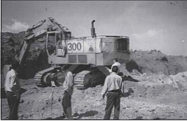
चित्र 12.2 : पंचपटमलाई बॉक्साइट खान में ध्वनि प्रदूषण की जाँच

ध्वनि प्रदूषण के सभी स्रोतों में से यातायात द्वारा पैदा किया गया शोर सबसे बड़ा क्लेश है। इसकी तीव्रता और प्रकृति इन घटकों पर निर्भर करता है जैसे कि वायुयान/वाहन/रेलगाड़ी के प्रकार, उन सड़कों की दशा तथा साथ-ही-साथ वाहन की स्थिति (आटोमोबाइल के संदर्भ में