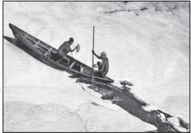
चित्र 12.1 : बहिःस्राव को काटते हुए : नई दिल्ली से संलग्न अति प्रदूषित यमुना नदी पर झाग (फोम) की व्यापक पर्त के बीच नौका चालन

बढ़ती हुई जनसंख्या और औद्योगिक विस्तारण के कारण जल के अविवेकपूर्ण उपयोग से जल की गुणवत्ता का बहुत अधिक निम्नीकरण हुआ है। नदियों, नहरों, झीलों तथा तालाबों आदि में उपलब्ध जल शुद्ध नहीं रह गया है। इसमें अल्प मात्रा में निर्लंबित कण, कार्बनिक तथा अकार्बनिक पदार्थ समाहित होते हैं। जब जल में इन पदार्थों की सांद्रता बढ़ जाती है तो जल प्रदूषित हो जाता है और इस तरह वह उपयोग के योग्य नहीं रह जाता। ऐसी स्थिति में जल में स्वतः शुद्धीकरण की क्षमता जल को शुद्ध नहीं कर पाती।