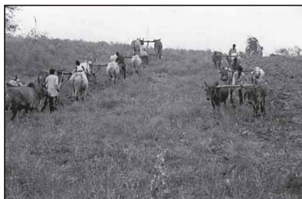
चित्र 12.5 : झबुआ में साझी संपदा संसाधन की भूमि समतलीकरण में सामुदायिक प्रतिभागिता (ए एस ए 2004)

इस अनुभव का एक रोचक पक्ष यह है कि समुदाय इस चरागाह प्रबंधन प्रक्रिया की शुरुआत करते कि इससे पहले ही पड़ोसी गाँव के एक निवासी ने उस पर अतिक्रमण कर लिया। गाँव वालों ने तहसीलदार को बुलाया और साझी ज़मीन पर अपने अधिकारों को सुनिश्चित कराया। इस अनुवर्ती संघर्ष को गाँव वालों द्वारा सुलझाया गया जिसके लिए उन्होंने साझी चरागाह भूमि पर अतिक्रमण करने वाले दोषी को अपने प्रयोक्ता समूह का सदस्य बनाकर उसे साझी चरागाह भूमि की हरियाली से लाभांश देना आरंभ किया। (साझी संपदा संसाधन के बारे में 'भूमि-संसाधन एवं कृषि' वाले अध्याय को देखें।)