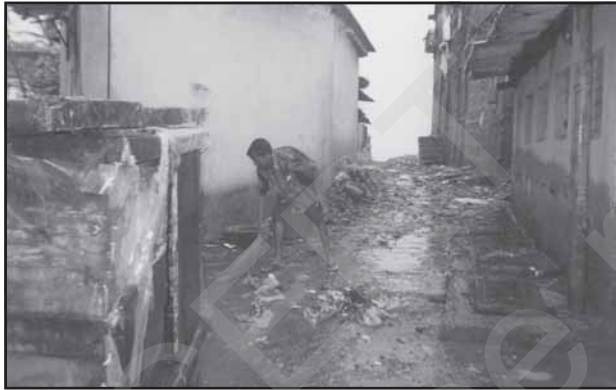
चित्र 12.3 : माहिम मुंबई में नगरीय अपशिष्ट का एक दृश्य