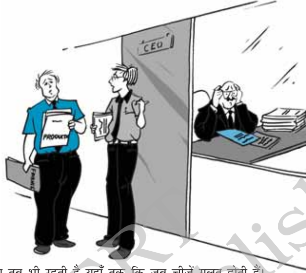
चित्र 8.1—प्रधानता तब भी रहती है यहाँ तक कि जब चीजें गलत होती हैं।

प्रणाली को लागू करने पर क्या इसके ऊपर होने वाला व्यय लाभकारी होगा अथवा नहीं। दूसरे शब्दों में वह आश्वस्त हो कि व्यय-आय से अधिक न हो।