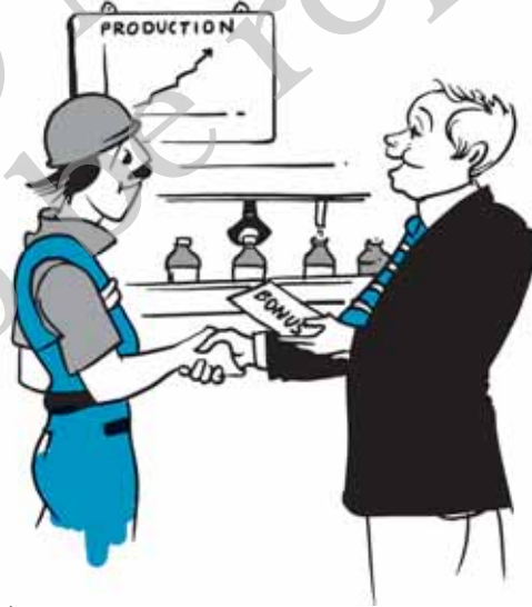
चित्र 2.1—प्रबंधक और कर्मचारी लाभ की आपस में भागीदारी करते हुए।

यदि कंपनी को लाभ होता है तो प्रबंधकों को चाहिए कि वह इसे