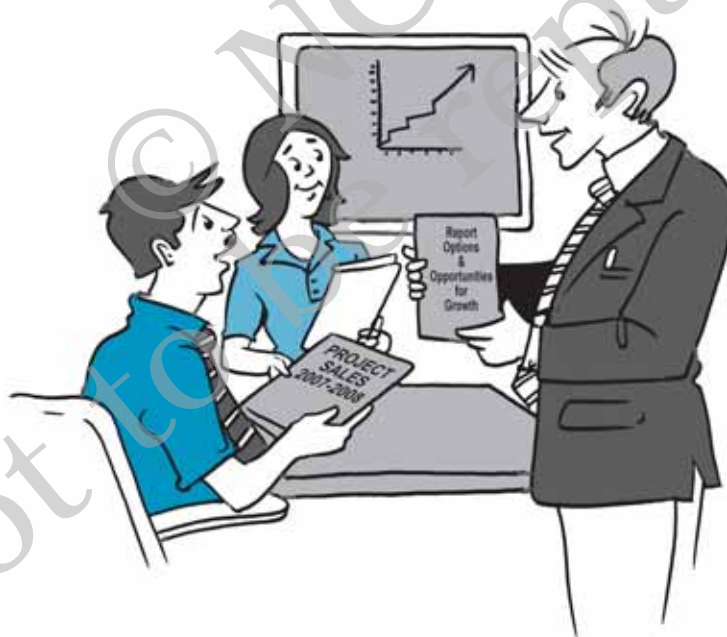
चित्र 2.4—कर्मचारी सुझाव प्रणाली—प्रशिक्षु प्रबंधकों का उत्साहवर्द्धन।

उपर्युक्त चर्चा से यह स्पष्ट है कि फेयॉल के प्रबंध के 14 सिद्धांत प्रबंध की समस्याओं पर विस्तृत रूप से लागू होते हैं तथा आज इनका प्रबंध की सोच पर गहरा प्रभाव पड़ा है। लेकिन जिस बदले हुए पर्यावरण में आज व्यवसाय किया जा रहा है, उसमें इन सिद्धांतों की व्याख्या बदल गई है। उदाहरण के लिए अब तक अधिकार एवं उत्तरदायित्व का अर्थ प्रबंधकों को शक्ति प्रदान करना था लेकिन आज हम फेयॉल के सिद्धांतों के वर्तमान गुणार्थ को समझने की स्थिति में हैं जो कि साथ के बॉक्स में दिए गए हैं।