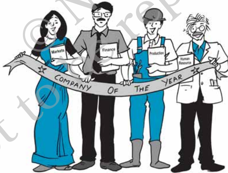
चित्र 1.1—टीम में साथ होने से प्रत्येक अधिक कार्य करता है।