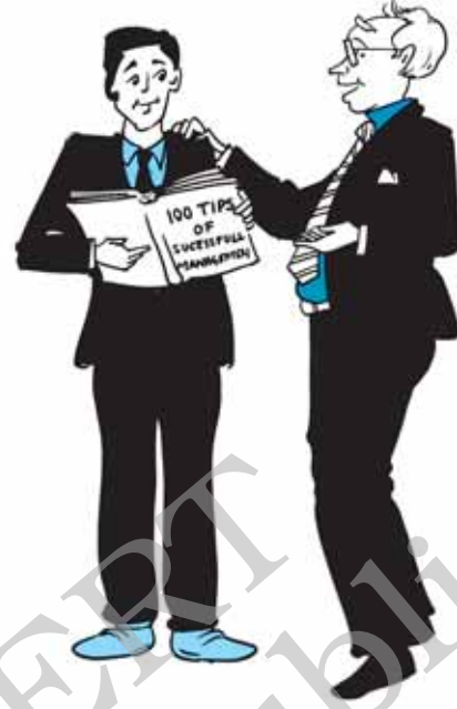
चित्र 1.3—आप सिर्फ किताबें पढ़कर प्रबंधन नहीं सीख सकते।

योजनाओं को पूरा करना होता है। इसके लिए (क) उच्च प्रबंधकों द्वारा बनाई गई योजना की व्याख्या करते हैं; (ख) अपने विभाग के लिए पर्याप्त संख्या में कर्मचारियों को सुनिश्चित करते हैं; (ग) उन्हें आवश्यक कार्य एवं दायित्व सौंपते हैं; (घ) इच्छित उद्देश्यों की प्राप्ति हेतु अन्य विभागों से सहयोग करते हैं। इसके साथ-साथ वे प्रथम पंक्ति के प्रबंधकों के कार्यों के लिए उत्तरदायी होते हैं।