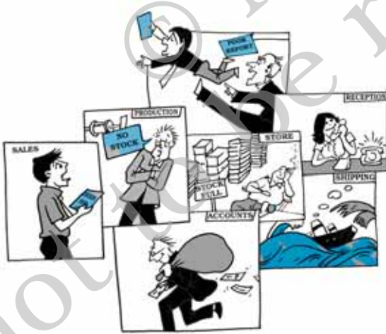
चित्र 1.5—समन्वय के न रहने से असमंजस होगा।

समन्वय वह शक्ति है जो, प्रबंध के अन्य सभी कार्यों को एक दूसरे से बांधती है। यह ऐसा धागा है जो संगठन के कार्य में निरंतरता बनाए रखने के लिए क्रय, उत्पादन, विक्रय एवं वित्त जैसे सभी कार्यों को पिरोए रखता है। समन्वय को कभी-कभी प्रबंध का एक अलग से कार्य माना