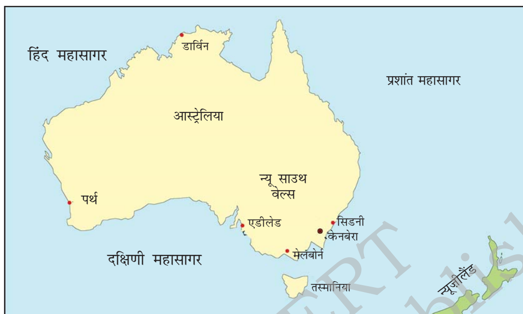
मानचित्र 2: आस्ट्रेलिया।

ऑस्ट्रेलिया में यूरोपीय आबादकारों, मूल निवासियों और ज़मीन के बीच आपसी रिश्तों का किस्सा उत्तरी और दक्षिणी अमरीका के किस्से से कई बिंदुओं पर मिलता-जुलता है, हालांकि इसकी शुरुआत 300 साल बाद हुई। मूल निवासियों के साथ हुई मुलाकात को लेकर कैप्टन कुक और उसके जत्थे के आरंभिक ब्यौरे मूल निवासियों के दोस्ताना व्यवहार के बारे में उत्साहपूर्ण हैं। लेकिन जब एक मूल निवासी ने कुक की हत्या कर दी - हवाई में, ऑस्ट्रेलिया में नहीं - तब ब्रिटिशों का रवैया पूरी तरह से उलट गया। जैसा कि प्रायः होता आया है, इस तरह की एक घटना औपनिवेशिक ताकतों द्वारा बाद में दूसरों के खिलाफ़ किए गए हिंसक व्यवहार का औचित्य साबित करने के लिए इस्तेमाल की गई।