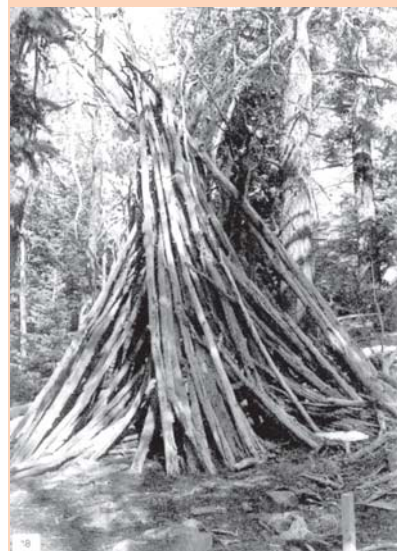
मूल निवासी का एक घर, 1862 पुरातत्त्वविदों ने इसे पहाड़ों के बीच से ले जाकर व्योमिंग के एक संग्रहालय में रखा।

यह महत्वपूर्ण है कि इसी समय (1840 के दशक से) उत्तरी अमरीका में 'मानवशास्त्र' विषय (जो कि फ़्रांस में विकसित हुआ था) की शुरुआत हुई। यह शुरुआत स्थानीय 'आदिम' समुदायों और यूरोप के 'सभ्य' समुदायों के बीच के अंतर के अध्ययन के लिए हुई थी। कुछ मानवशास्त्रियों ने यह स्थापित किया कि जिस तरह यूरोप में 'आदिम' लोग नहीं पाए जाते, उसी तरह अमरीकी मूल निवासी भी 'समाप्त हो जाएँगे'।