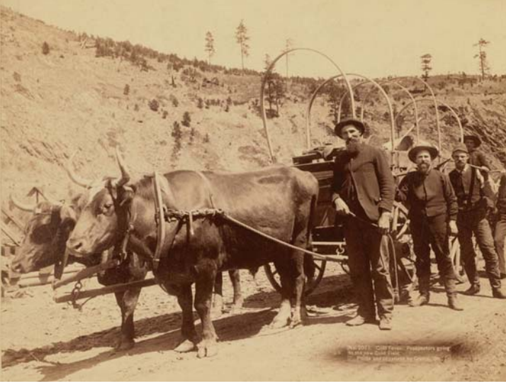
‘गोल्ड रश’ के दौरान कैलीफोर्निया जाते लोग, कैमराचित्र