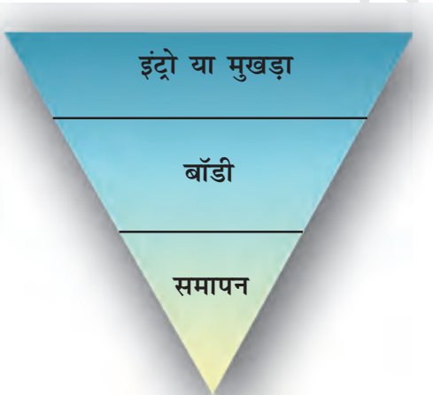
उलटा पिरामिड में समाचार का ढाँचा