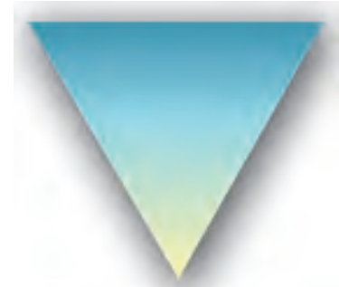
उलटा पिरामिड-समाचार लेखन शैली