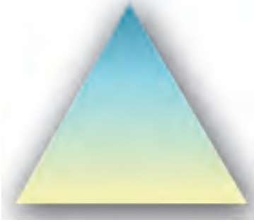
सीधा पिरामिड-कथात्मक लेखन

(इंवर्टेड पिरामिड स्टाइल) के नाम से जाना जाता है। यह समाचार लेखन की सबसे लोकप्रिय, उपयोगी और बुनियादी शैली है। यह शैली कहानी या कथा लेखन की शैली के ठीक उलटी है जिसमें क्लाइमेक्स बिल्कुल आखिर में आता है। इसे उलटा पिरामिड इसलिए कहा जाता