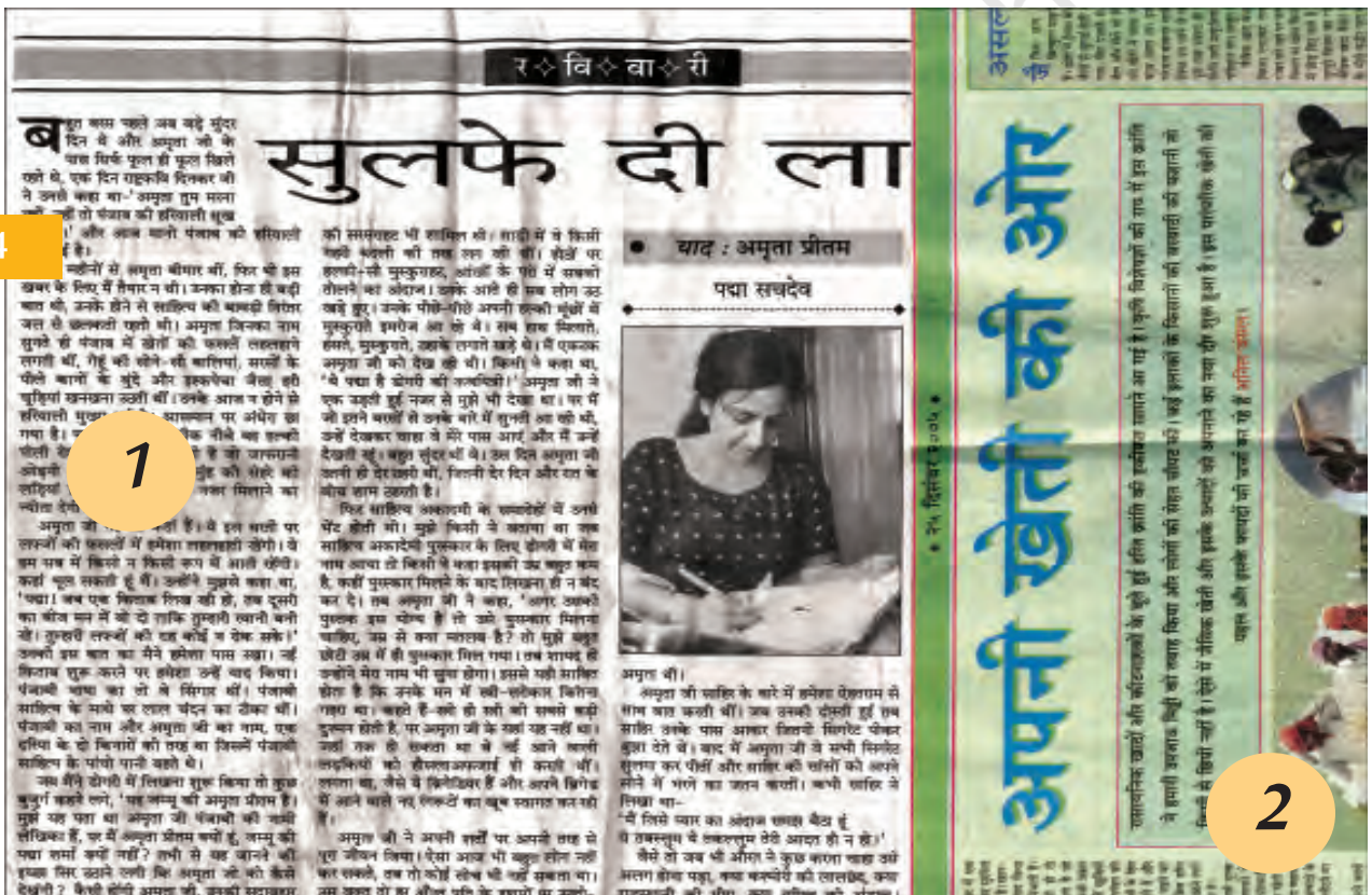
1. व्यक्तिचित्र फ्रीचर, 13 नवंबर 2005 2. समाचार फ्रीचर, 25 दिसंबर 2005

तात्पर्य यह है कि फ्रीचर को किसी बैठक या सभा के कार्यवाही विवरण की तरह नहीं लिखा जाना चाहिए। साथ ही, फ्रीचर कोई नीरस शोध रिपोर्ट भी नहीं है। वह बड़ी घटनाओं, कार्यक्रमों और आयोजनों की सूखी और बेजान रिपोर्ट भी नहीं है। फ्रीचर आमतौर पर तथ्यों, सूचनाओं और