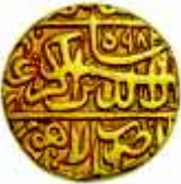
اکبر کے دور کے سونے کی ہیر