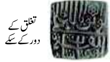
تفلیق کے دور کے سکے