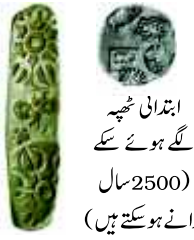
ابتدائی ٹھیکے لگے ہوئے سکے (2500 سال پرانے ہو سکتے ہیں)

زر کی جدید شکلوں میں کاغذ کے نوٹ اور سکوں جیسی کرنسی شامل ہے ان چیزوں کو جنہیں پہلے زر کے طور پر استعمال کیا جاتا تھا، کے برعکس جدید کرنسی قیمتی دھات جیسے سونا، چاندی اور تانبہ سے نہیں بنی ہوتی۔ اور مویشی کے برعکس یہ نہ تو روزمرہ کے استعمال میں ہے جدید کرنسی ان میں سے اب کسی چیز کا استعمال نہیں کرتی۔ پھر کیوں اسے ذریعہ مبادلہ کے طور پر تسلیم کیا جاتا ہے۔ اسے ذریعہ مبادلہ کے طور پر اس لیے استعمال کیا جاتا ہے کیونکہ کرنسی