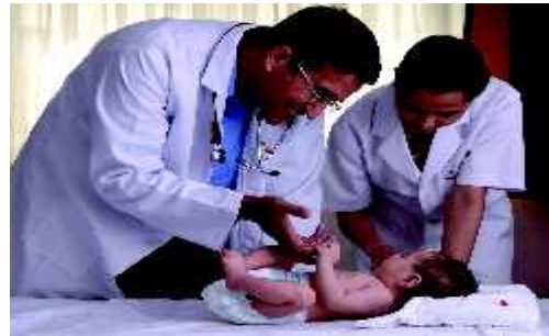
بہت سے بچوں کی بنیادی طبی دیکھ بھال نہیں ہوتی