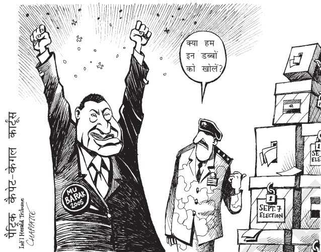
मुबारक फिर चुने गए