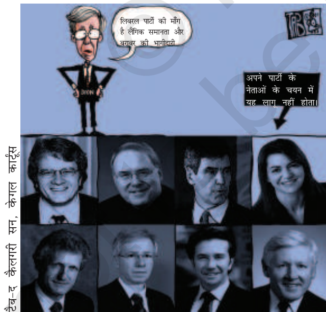
उदारवादी लैंगिक समानता