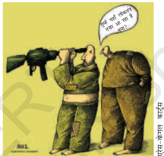
लोकतंत्र पर नज़र