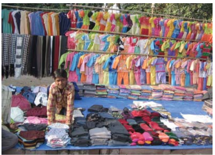
सिलेसिलाए वस्त्रों के छोटे व्यापारी बहुराष्ट्रीय कंपनियों के ब्रांड और आयात दोनों से कड़ी प्रतिस्पर्धा का सामना करते हुए।

सामान्यतः व्यापार के खुलने से वस्तुओं का एक बाज़ार से दूसरे बाज़ार में आवागमन होता है। बाज़ार में वस्तुओं के विकल्प बढ़ जाते हैं। दो बाज़ारों में एक ही वस्तु का मूल्य एक समान होने लगता है। अब दो देशों के उत्पादक एक दूसरे से हजारों मील दूर होकर भी एक दूसरे से प्रतिस्पर्धा कर सकते हैं। इस प्रकार, विदेश व्यापार विभिन्न देशों के बाज़ारों को जोड़ने या एकीकरण में सहायक होता है।