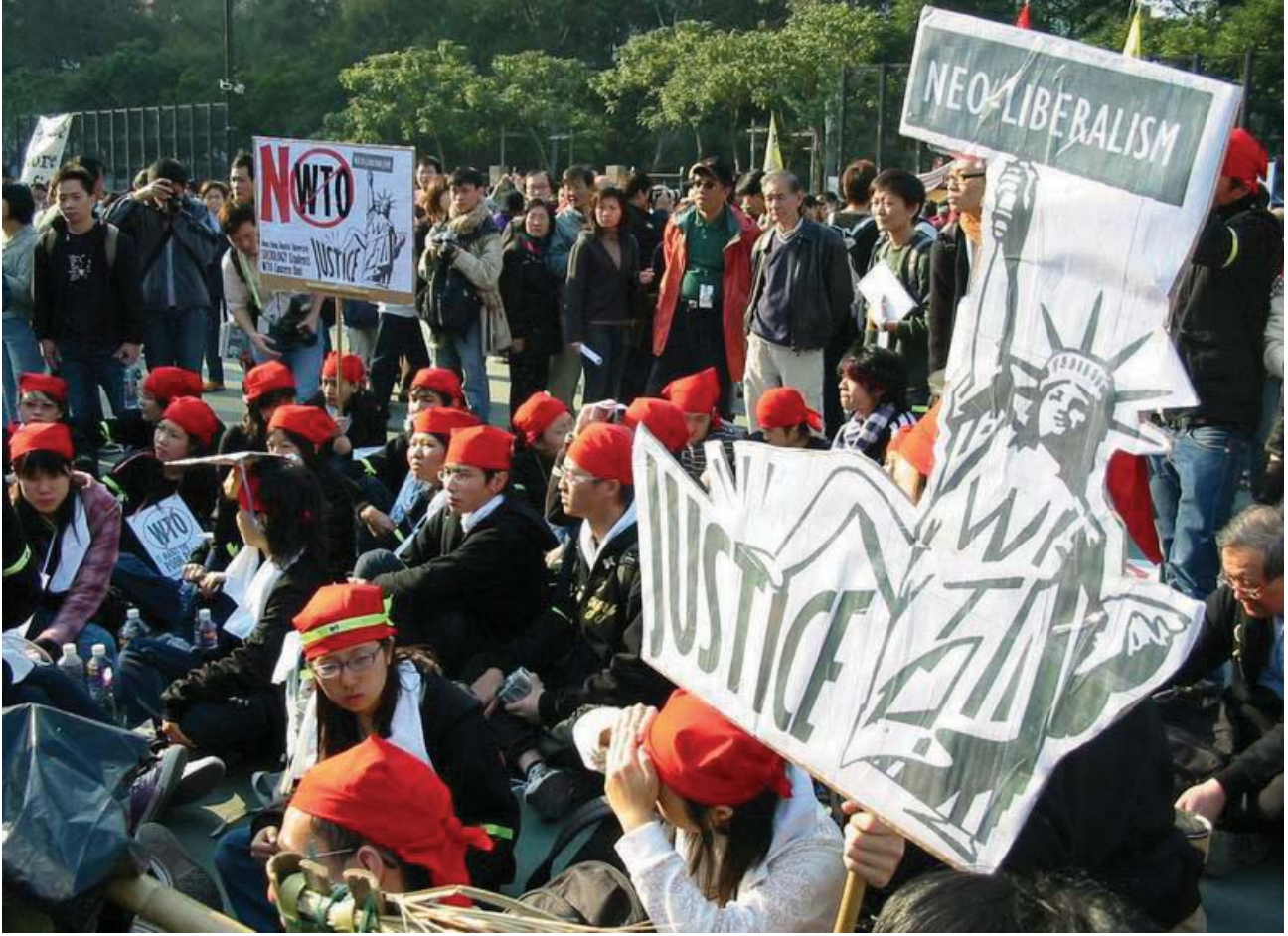
हांगकांग में डब्लू.टी.ओ. के खिलाफ प्रदर्शन-2005