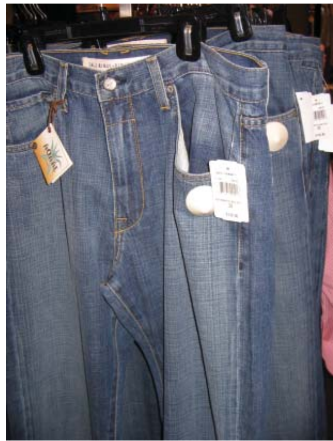
विकासशील देशों में उत्पादित जीन्स अमेरिका में 6500 रु. में बेची जा रही है।

बहुराष्ट्रीय कंपनियाँ एक अन्य तरीके से उत्पादन नियंत्रित करती हैं। विकसित देशों की बड़ी बहुराष्ट्रीय कंपनियाँ छोटे उत्पादकों को उत्पादन का ऑर्डर देती हैं। वस्त्र, जूते-चप्पल एवं खेल के सामान ऐसे उद्योग हैं, जहाँ विश्वभर में बड़ी संख्या में