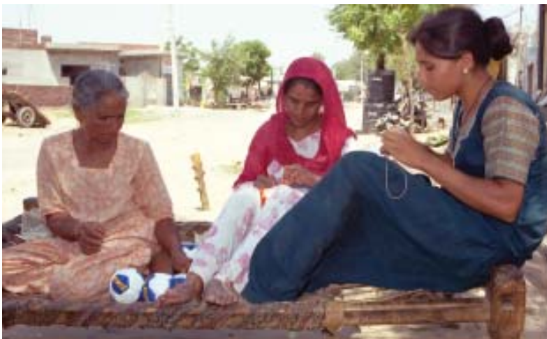
लुधियाना के एक घर में एक बड़ी बहुराष्ट्रीय कंपनी के लिए फुटबाल-निर्माण का चित्र

इस प्रकार, हम देखते हैं कि बहुराष्ट्रीय कंपनियाँ कई तरह से अपने उत्पादन कार्य का प्रसार कर रही हैं और विश्व के कई देशों की स्थानीय कंपनियों के साथ पारस्परिक संबंध स्थापित कर रही हैं। स्थानीय कंपनियों के साथ साझेदारी द्वारा, आपूर्ति के लिए स्थानीय कंपनियों का इस्तेमाल करके और स्थानीय कंपनियों से निकट प्रतिस्पर्धा करके अथवा उन्हें खरीद कर बहुराष्ट्रीय कंपनियाँ दूरस्थ स्थानों के उत्पादन पर अपना प्रभाव जमा रही हैं। परिणामतः दूर-दूर स्थानों पर फैला उत्पादन परस्पर संबंधित हो रहा है।