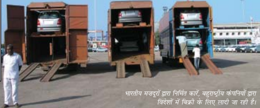
भारतीय मजदूरों द्वारा निर्मित कारें, बहुराष्ट्रीय कंपनियों द्वारा विदेशों में विक्री के लिए लादी जा रही हैं।