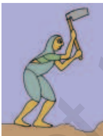
श्रम सभी संपत्तियों का स्रोत है।

उत्खनन सहित कृषि (जिसे प्राथमिक क्षेत्रक भी कहते हैं) और विनिर्माण (जिसे द्वितीयक क्षेत्रक भी कहते हैं), इन दो क्षेत्रकों के बीच उत्पादन-गतिविधियों का विभाजन आर्थिक विकास का संभवतः प्रथम दृष्ट स्वरूप था। यह विभाजन 'श्रम-विभाजन' की प्रक्रिया के माध्यम से हुआ। यह नाम अर्थशास्त्र के जनक एडम स्मिथ द्वारा दिया गया था। इस प्रक्रिया की संक्षिप्त व्याख्या नीचे की गई है।