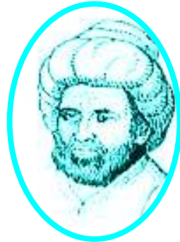
मुहम्मद इब्न मूसा अल-ख्वारिज़्मी (780 – 850 सा.यु.)

प्रमेयिका एक सिद्ध किया हुआ कथन होता है और इसे एक अन्य कथन को सिद्ध करने में प्रयोग करते हैं।