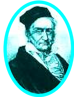
कार्ल फ्रैड्रिक गॉस (1777 – 1855)

अंकगणित की आधारभूत प्रमेय के रूप में विख्यात होने से पहले, प्रमेय 1.2 का संभवतया सर्वप्रथम वर्णन यूक्लिड के एलीमेंट्स की पुस्तक IX में साध्य (proposition) 14 के रूप में हुआ था। परंतु इसकी सबसे पहले सही उपपत्ति कार्ल फ्रैड्रिक गॉस (Carl Friedrich Gauss) ने अपनी कृति डिसक्विशंस अरिथमेटिकी (Disquisitiones Arithmeticae) में दी। कार्ल फ्रैड्रिक गॉस को प्रायः 'गणितज्ञों का राजकुमार' कहा जाता है तथा उनका नाम सभी समयकालों के तीन महानतम गणितज्ञों में लिया जाता है, जिनमें आर्किमिडीज़ (Archimedes) और न्यूटन (Newton) भी सम्मिलित हैं। उनका गणित और विज्ञान दोनों में मौलिक योगदान है।