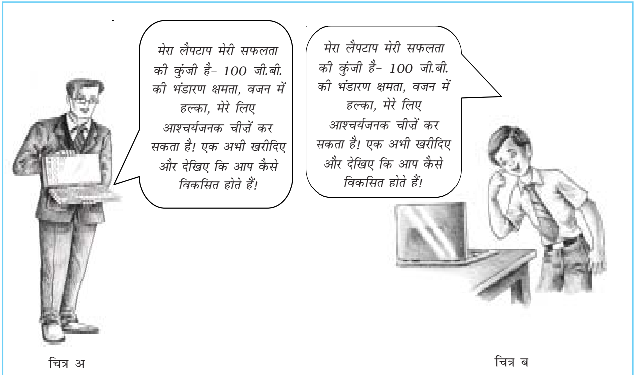
चित्र 6.1 कौन सा चित्र आपको एक लैपटॉप खरीदने के लिए अधिक व्यग्र करेगा- चित्र अ या चित्र ब? क्यों?

इन सबके अतिरिक्त, एक अभिवृत्ति प्रस्तुत सूचना की दिशा में या प्रस्तुत सूचना के विपरीत दिशा में परिवर्तित हो सकती है। दाँतों को ब्रश करने के महत्त्व का वर्णन करने वाला पोस्टर दंत-रक्षा के प्रति सकारात्मक अभिवृत्ति को प्रबल बनाएगा। परंतु यदि लोगों को दाँतों में भयावह गुहिका या छिद्र वाले चित्र दिखाए जाएँ तो वे इन चित्रों पर विश्वास नहीं करेंगे, और दंत-रक्षा के प्रति कम सकारात्मक हो जाएँगे। शोध में यह पाया गया है कि लोगों को समझाने में भय कभी-कभी बहुत अच्छी तरह से कार्य करता है, परंतु कोई संदेश यदि बहुत अधिक भय उत्पन्न करता है तो यह संग्राहक (reciever) को दूसरी दिशा में ले जाता है और इसका विश्वासोत्पादक प्रभाव भी कम हो जाता है।