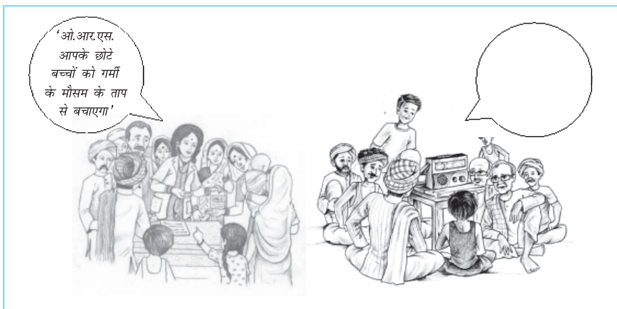
चित्र 6.3 आमने-सामने की अंतःक्रिया बनाम संचार-माध्यम का प्रसारण। कौन बेहतर कार्य करता है? क्यों?

का प्रसार अधिक प्रभावशाली तरीके से होगा यदि सामुदायिक सामाजिक कार्यकर्ता एवं चिकित्सक संदेश का प्रसार मात्र रेडियो पर इसके लाभ बताने के स्थान पर लोगों से प्रत्यक्ष रूप से बातचीत करके करते हैं (चित्र 6.3 देखें)। आजकल दृश्य माध्यम, जैसे - दूरदर्शन और इंटरनेट के द्वारा प्रसारण आमने-सामने की अंतःक्रिया के समान है परंतु यह उसका विकल्प नहीं है।