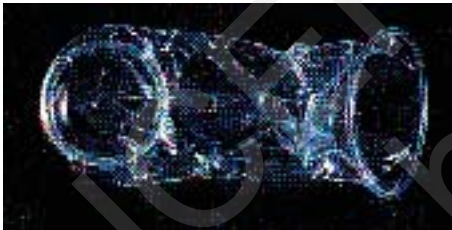
चित्र 4.1 (ब) स्त्री के लिए कंडोम

बाह्य स्खलन या अंतरित मैथुन (कोइटस इन्ट्रप्सन) एक अन्य विधि है जिसमें पुरुष साथी संभोग के दौरान वीर्य स्खलन से ठीक पहले स्त्री की योनि से अपना लिंग बाहर निकाल कर वीर्यसेचन से बच सकता है। स्तनपान अनार्तव (लैक्टेशनल एमेनोरिया) विधि भी इस तथ्य पर निर्भर करती है कि प्रसव के बाद, स्त्री द्वारा शिशु को भरपूर स्तनपान कराने के दौरान अंडोत्सर्ग और आर्तव चक्र शुरू नहीं होता है। इसलिए जितने दिनों तक माता शिशु को पूर्णतः स्तनपान कराना जारी रखती है (इस दौरान शिशु को माँ के दूध के अलावा, ऊपर से पानी या अतिरिक्त दूध भी नहीं दिया जाना चाहिए। यह अवधि 4-6 माह की होती है), गर्भधारण के अवसर लगभग शून्य होते हैं। यह विधि प्रसव के बाद ज्यादा से ज्यादा 6 माह की अवधि तक ही कारगर मानी गई है। चूँकि उपर्युक्त विधियों में किसी दवा या साधन का उपयोग नहीं होता, अतः इसके दुष्प्रभाव लगभग शून्य के बराबर हैं। हालाँकि, इसके असफल रहने की दर काफी अधिक है।