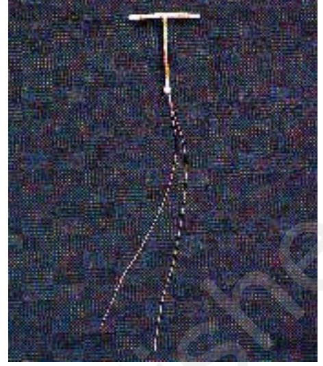
चित्र 4.2 कॉपर टी

वर्षों में कंडोम के उपयोग में तेजी से वृद्धि हुई है, क्योंकि इससे गर्भधारण के अलावा यौन संचारित रोगों तथा एड्स से बचाव जैसे अतिरिक्त लाभ हैं। स्त्री एवं पुरुष दोनों के ही कंडोम उपयोग के बाद फेंकने वाले होते हैं। इन्हें स्वयं ही लगाया जा सकता है और इस तरह उपयोगकर्ता की गोपनीयता बनी रहती है। डायफ्रॉम, गर्भाशय ग्रीवा टोपी तथा वॉल्ट आदि भी रबर से बने रोधक उपाय हैं। जो स्त्री के जनन मार्ग में सहवास के पूर्व गर्भाशय ग्रीवा को ढकने के लिए लगाए जाते हैं। ये गर्भाशय ग्रीवा को ढक कर शुक्राणुओं के प्रवेश को रोककर गर्भाधान से छुटकारा दिलाते हैं। इन्हें पुनः इस्तेमाल किया जा सकता है। इसके साथ ही इन रोधक साधनों के साथ-साथ शुक्राणुनाशक क्रीम, जेली एवं फोम (झाग) का प्रायः इस्तेमाल किया जाता है, जिससे इनकी गर्भनिरोधक क्षमता काफी बढ़ जाती है।